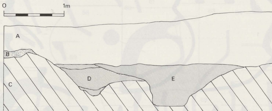
Fig. 89. Doorsnede door de grachten; legende verklaard in de tekst.

in Varia I, Arch. Belg. 232, 1980, 5-18.) werd vastgesteld dat het centrale deel van de grachten rond middeleeuwse en vooral laat-middeleeuwse sites, dieper werd uitgegraven en een vlak bodemverloop had. Dit is in mindere mate het geval voor de oudste gracht, maar is duidelijk wat de jongste betreft. Ook de heraanleg en het oversnijden van de grachten is te vergelijken met de grachtevolutie in Dudzele.