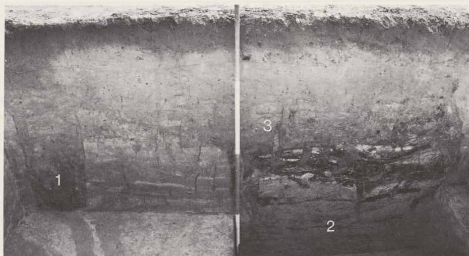
Fig. 61. Zicht op een paalspoor (1) en een silo (?) (2) door latere vergraving (3) oversneden.

(fig. 60, 4; fig. 61, 2). Duidelijk afgelijnd was een haakvormige standgreppel, die de hoek van een houtconstructie uitmaakte (fig. 60, 5). Het standspoor waarin 2 paalgaten zaten (fig. 60, 6) doorsnijdt één van bovenvermelde kuilen met roodgebrande huttenleem. De houtconstructie is bij de aanleg van de Heurnestraat en de Amandusstraat grotendeels weggegraven, zodat we de noord- en westzijde maar over een lengte van respectievelijk 6,40m en 4,50m kennen. Met dit houten gebouw gaan een drietal kuilen samen (fig. 60, 7; fig. 61, 3), die de silo (?), de bruingrijze paalgaten en een L-vormig kuiltje (fig. 60, 8) oversnijden. In de meest noordelijk gelegen kuil mondt een greppel uit, die we over een afstand van 4,50m volgden (fig. 60, 9).