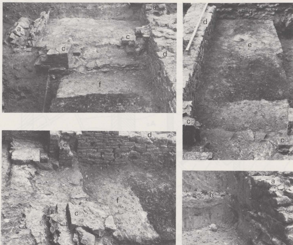
Fig. 60. De toegang tot de kelderruimte van het oudste gebouw. a : de muurtjes van de buitentrap; b : de werklaag van het oudste gebouw, c : de deurposten, d : de scheidingsmuur tussen de twee gebouwvleugels, e : de verbrande vloer, f : opgravingen Bequaert, g : keldermuur van de gotische zaal.

en slaapkamer kan hebben gefungeerd; ten slotte deed de eronder liggende kelderruimte mogelijk dienst als stapelplaats en keuken.