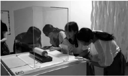
図8：ブラインド・ツアーで「SUGAR」（藤本由紀夫）の角砂糖がまわる音に耳を傾ける（2019年）

この展覧会が難しいのは、そもそものコンセプトが五感を駆使する展示だったということである。そのため、初回に出てきた学生たちの案は、すべて「触ってみよう」あるいは