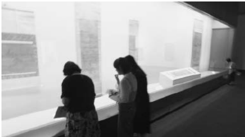
図5：「生きている山水」展では、繊細な山水画を扱った（2018年）

2018年の展覧会は、「生きている山水——廬山をのぞむ古今のまなざし」展（2018年8月31日～9月30日）である（図5～7）。対象となる展覧会は、集中講義の期間に開催しているものになるが、選択の余地がない分、困難も伴う。「生きている山水」展は、古くから絵画の主題として度々描かれてきた廬山をテーマにしており、中国絵画や書画と、古典を再