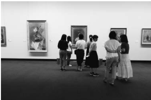
図3：「岡山の美術展」を視察する。中央にある作品は国吉康雄「夜明けが来る」（2017年）

2017年の集中講義の期間に開催中だった展覧会は、「岡山の美術展」（2017年8月30日～9月24日）で、いわゆるコレクション展である（図3、4）。展示された作品の中から、多様な解釈の可能性があるものを岡本が選出し、そこから2人で相談して5つ（6作品）に絞った。選んだのは、原田直次郎「風景」（1886年）、国吉康雄「夜明けが来る」（1944年）、斎藤真一「瞽女旅姿」（1980年）、林皓幹「垣間見」（1922年）、正阿弥勝義「穂落之図（鶴香炉）」「香盒（亀）」をセットで（19世紀）。前者3作品は油彩・カンバス、林の作品は絹本着色・4曲1双、そして正阿弥の2作品は銀・合金である 10） 。