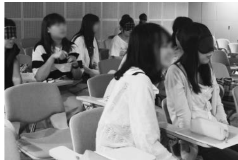
図2：「ブラインド・トーク—聴くワークショップ」はベアの片方がアイマスクをする(2018年)