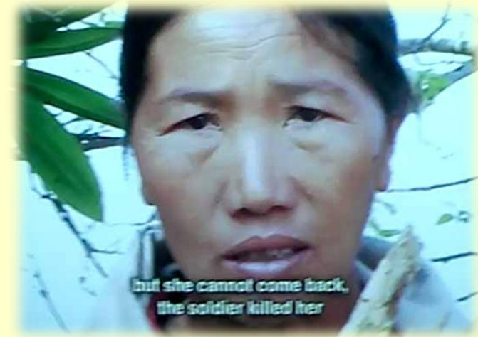
Amar Kanwar The Lightning Testimonies, 2007