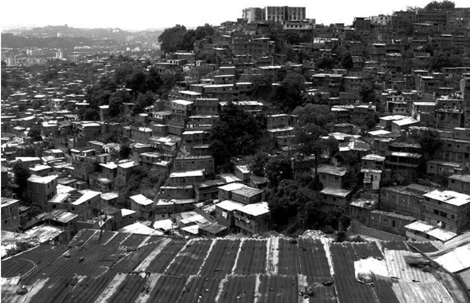
Barrios en Petare.

Actualmente, en la práctica, a pesar de estarse distribuyendo la tierra, otorgándosele a los ocupantes un título registrado, algunos barrios siguen siendo desalojados, y a la mayoría de éstos, al menos en el área metropolitana de Caracas, no se les atiende debidamente, a fin de evitar o detener el aceleramiento del deterioro de los terrenos donde se ubican. Esta falta de atención los lleva a sufrir deslizamientos, que poco a poco reducen el área habitable e incluso ocasionan el colapso de estructuras, con pérdida de vidas humanas. A esto se añade la cuestión de la violencia e inseguridad, que muchas veces se traduce en una forma obligada —no deseada— de abandonar el barrio para conservar la vida. Además, por la misma razón, parte de la población ciudadana que no vive en los barrios sigue considerándolos como territorios que deberían ser suprimidos, al menos algunos de ellos, los que parecen amenazarlos, aunque sea sólo en el plano estético.