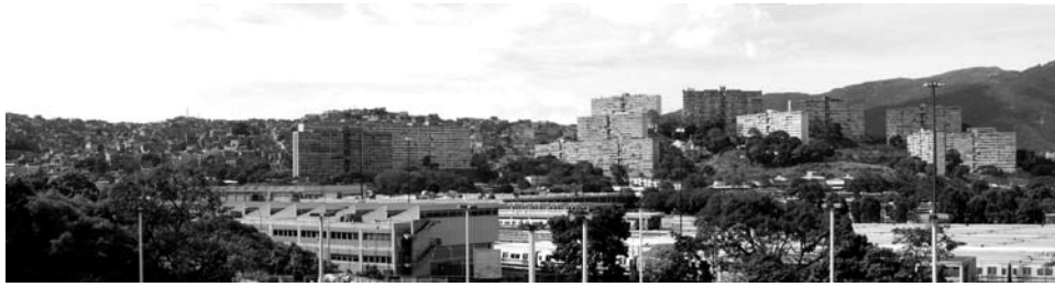
Lomas de Urdaneta.

buscamos para lograr una ciudad donde podamos vivir todos como seres humanos. Así los planificadores tendrán más probabilidades de ver realizadas sus propuestas, por más utópicas que sean.