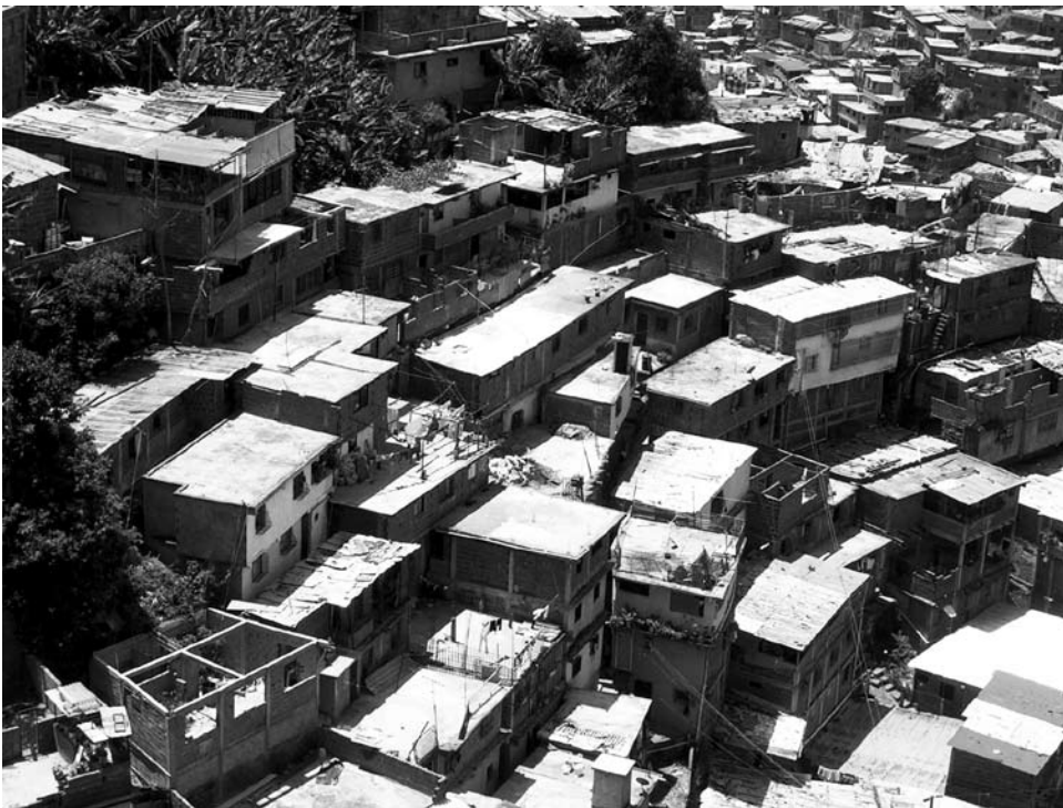
Los macizados y el desarrollo progresivo.

En su intervención Bolívar hizo énfasis en que la inseguridad está causando desplazamientos y afecta el capital social y cultural (cultura, arraigo) caraqueño. Insistía en que el intangible está en riesgo, tanto o más que otros aspectos materiales, que también son muy importantes para los habitantes de los barrios. Para él, las relaciones sociales e interrelaciones psicológicas relativas al arraigo —el mundo basado en la relación que existe en los barrios— requieren un tiempo, difícil de determinar, para construirse o reconstruirse, razón por la cual el desplazamiento es más complicado de resolver que por