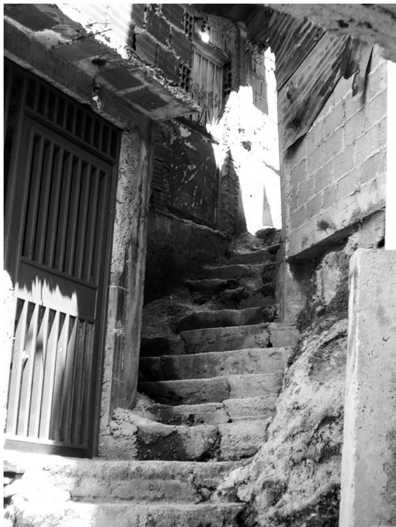
Caminar entre las viviendas.

me por “barrios de ranchos” y su diferencia con “arrabales”. Las investigaciones históricas, que seguimos con interés, contribuirán a clarificar estas definiciones. Sin embargo, la cita evidencia que desde el principio nadie ha sido capaz de controlar lo que pasaba. Se deja hacer. Poca gente sigue las regulaciones existentes, pues es de destacar que no sólo los barrios infringen las normas y otras reglas para el desarrollo urbano, en casi todos los territorios construidos o reconstruidos en la ciudad podemos encontrar infracciones a las leyes, reglamentaciones u ordenanzas vigentes. Parafraseando el Evangelio de San Juan, aquel de vosotros que esté sin pecado que le arroje la primera piedra , preguntamos: ¿cuántas urbanizaciones y edificaciones quedarían en pie, en el área metropolitana de Caracas, si se exigiera el permiso de construcción y/o la cédula de habitabilidad?