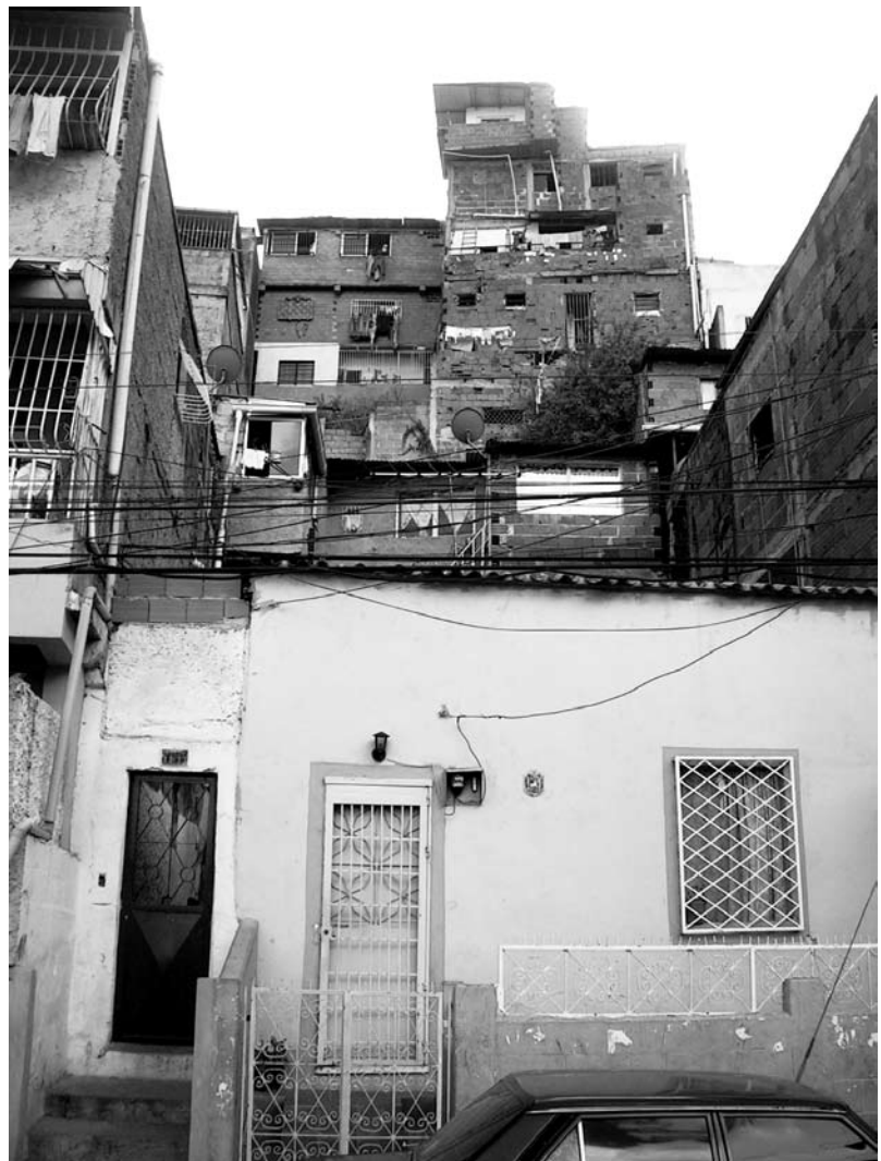
Problemas de la densificación - Zona Cementerio.

Como decíamos antes, el reconocimiento tiene que mirar tanto la parte de los barrios, como de los “no barrios”. En ambas tiene que haber modificaciones. Conscientes entonces de la complejidad del reconocimiento de los barrios, adicionaremos algunas ideas que han surgido del análisis de su situación, y que consideramos importante sean tomadas en cuenta cuando se decida emprenderlo.