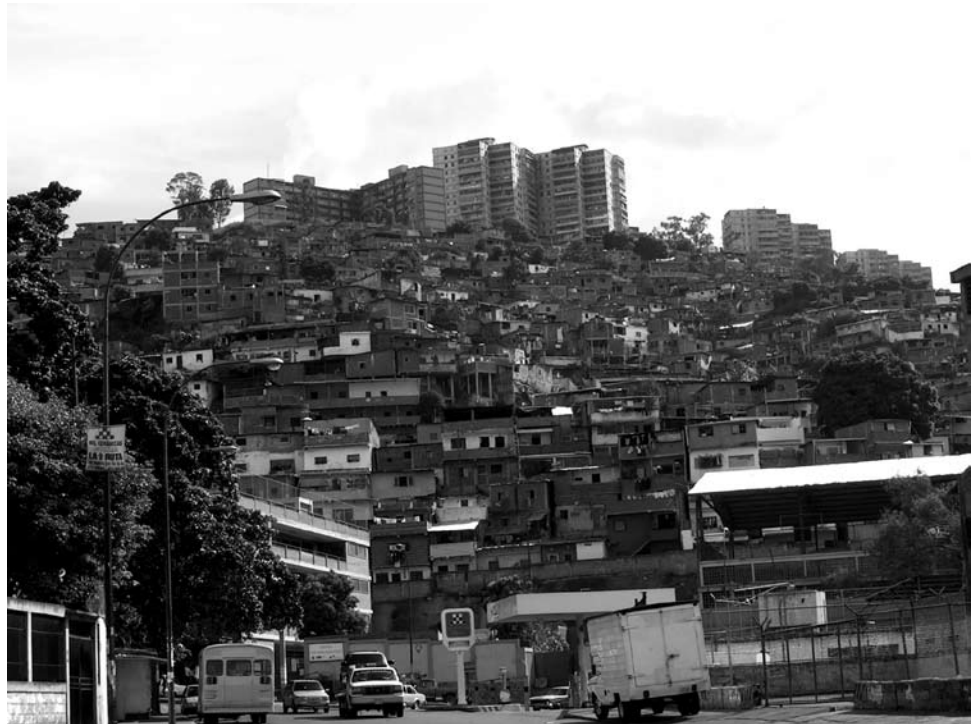
23 de Enero y barrios en Caracas