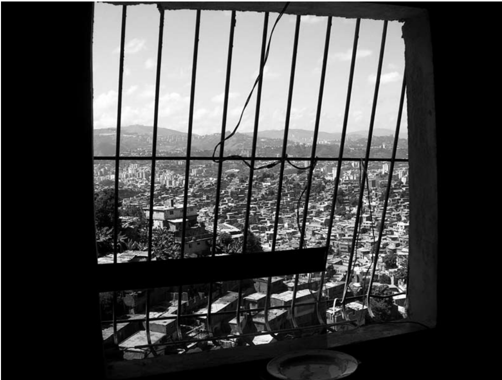
Ventana panorámica Foto Julian Blanco.