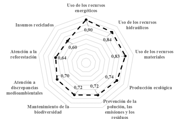
Figura 4. Índices de criticidad de los FCE asociados a la dimensión ambiental.