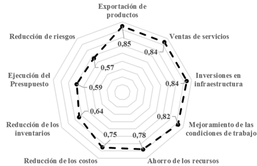
Figura 2. Índices de criticidad de los FCE asociados a la dimensión económica.

Luego se calcularon los índices de criticidad ( Ic_i ) para cada uno de los Factores Críticos de Éxito de las dimensiones económica, social y ambiental. Los resultados se muestran en las Figs. 2, 3 y 4.