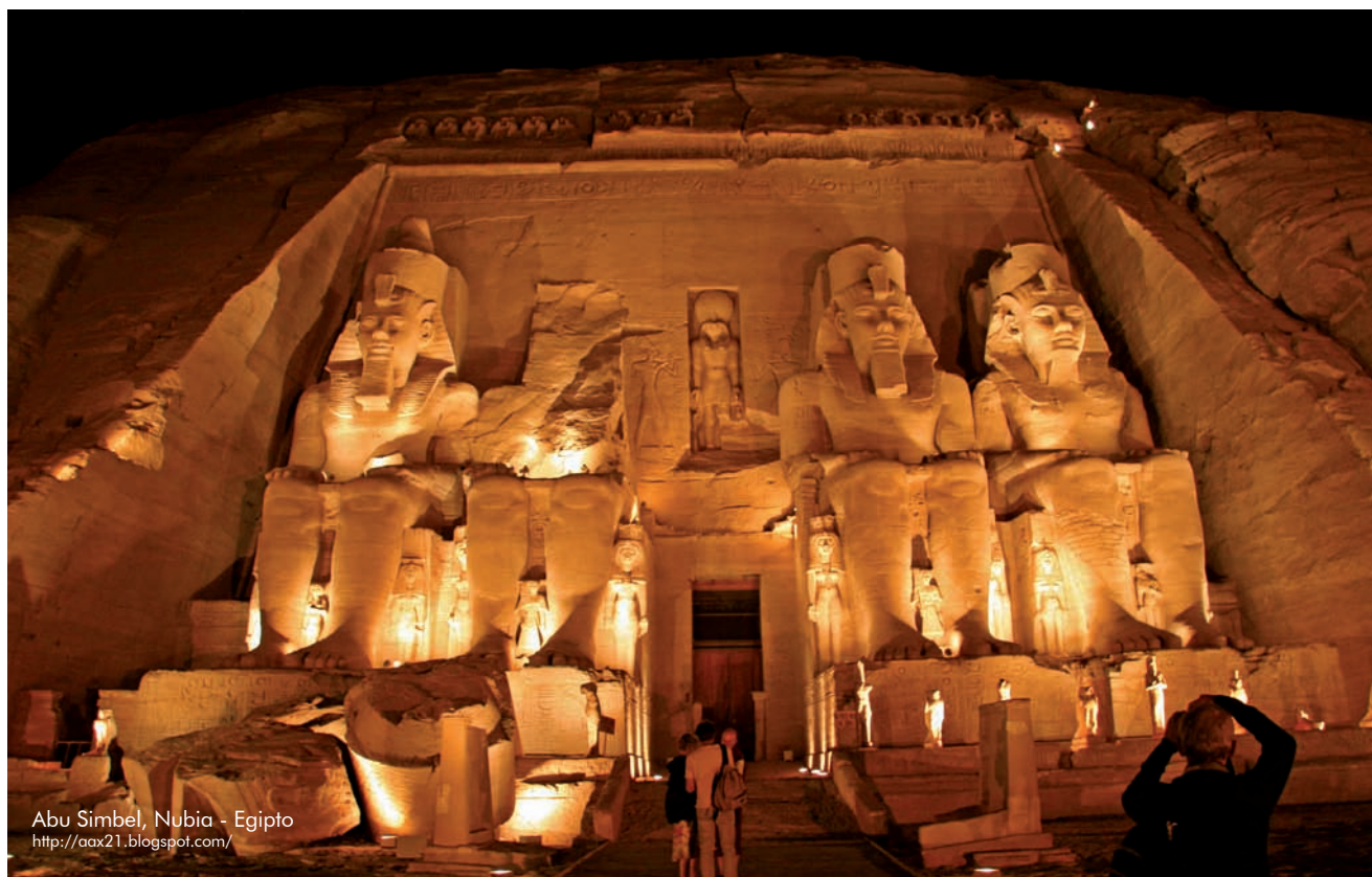
Abu Simbel, Nubia - Egipto http://aax21.blogspot.com/

La Calidad Académica, un Compromiso Institucional