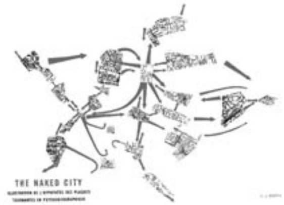
Figura 7. La ciudad desnuda. The Naked City

Puede que la popular concepción de Koolhaas como cínico, sea refutada por su uso del concepto de Simmel, que sugiere un interés verdadero en la humanidad y, una manera no utópica sino optimista de pensar sobre la sociedad y la manera en la que se desarrolla. Para Koolhaas, la congestión y su resultante hibridación y mutación, no son fines en sí mismos: “la congestión es interesante