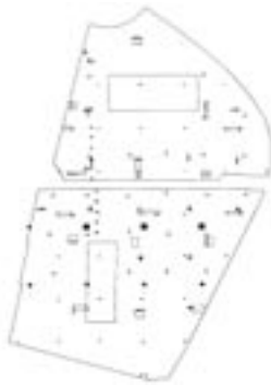
Figura 3. Confeti tectónico / OMA at la Villette: the punctual grids