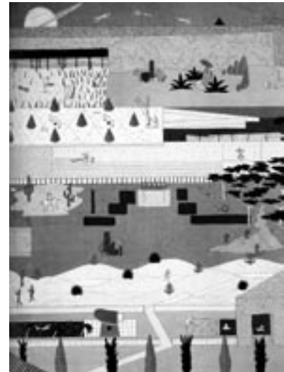
Figura 2. Paisaje ordenado / OMA at La Villette detail model

Ambos proyectos partieron de una aproximación similar, en la que los elementos funcionales del programa deberían distribuirse por toda la superficie del parque, creando las condiciones necesarias para el encuentro inesperado entre música, deporte, tecnología y naturaleza. Los elementos principales del parque, existentes o planeados, eran insertados cual elementos hallados. Los bordes del parque no eran diseñados con una demarcación precisa; a pesar del hecho de que los límites existentes –una vía elevada, un canal y una vía arteria de flujo pesado, formaban ya un conjunto ambiguamente