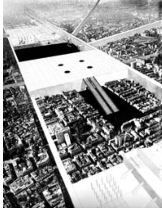
Figura 5. Exodus / The Exodus Project