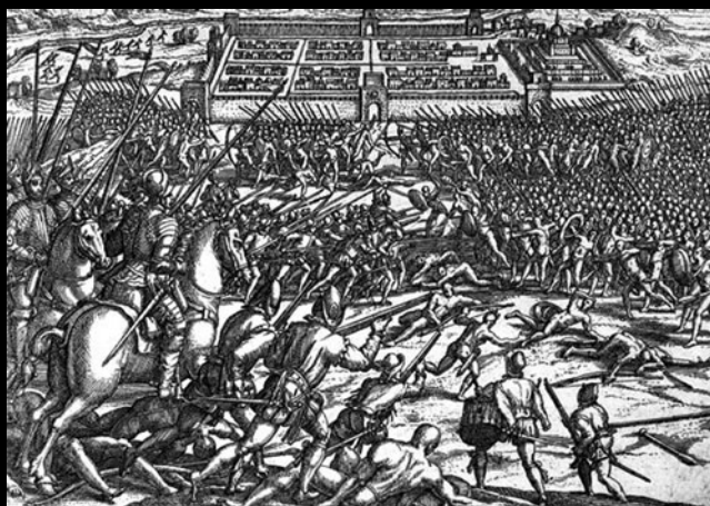
Tropas españolas atacan Cuzco, 1533.