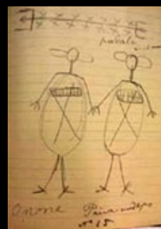
Dibujos caribes, siglo XX.