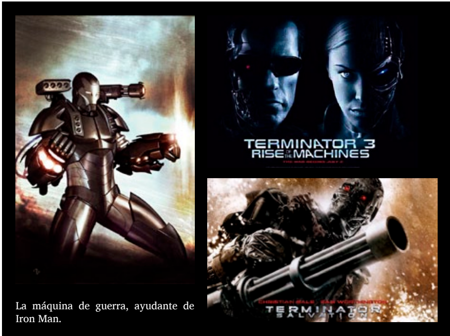
La máquina de guerra, ayudante de Iron Man.

Fuentes: Máquina de Guerra. Póster de la película Iron Man: Director of S.H.I.E.L.D. #33 . Diseño de Adi Granov. 2008 — Póster de la película Terminator 3: Rise of the Machines . Columbia Pictures – Warner Bros. Pictures – Intralink Film Graphic Design. 2003 — Póster de la película Terminator Salvation . Columbia Pictures – Warner Bros. Pictures. 2007.