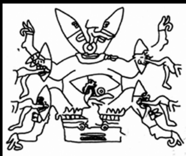
Códice azteca, siglo XVI.