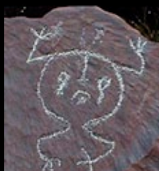
Petroglifo taíno, siglo XV.