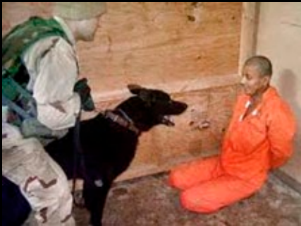
Criaban a feroces perros de caza para que devoraran a un Indio en el acto.

Por cierto, la práctica de la violencia siempre ha sido parte de la historia humana, pero como esos modernos ejemplares, Shakespeare y Hobbes, comprendieron, llegó un momento alrededor del siglo XVI en que colectivamente gritamos: “¡Devastación! ¡Que se suelten a los perros de guerra!”. Los antropólogos no argumentarían que hasta este momento la violencia era de alguna forma ausente o menor, sino que los propósitos y significados de las relaciones sociales de la guerra y la violencia eran secundarios a otros tipos de relaciones sociales y prácticas sobrevenidas. El ritual y la ceremonia, el parentesco y los modos de intercambio social, las tecnologías y las logísticas, tendían a inhibir la órbita de la guerra a gran escala como forma habitual y persistente de relación social. Ciertamente, Estados e imperios poderosos eran capaces de devastar a las poblaciones locales, pero la máquina-de-guerra griega de Alejandro, la máquina-de-guerra romana bajo varios emperadores, o las conquistas de los asirios y los mongoles, siempre tenían un carácter episódico.