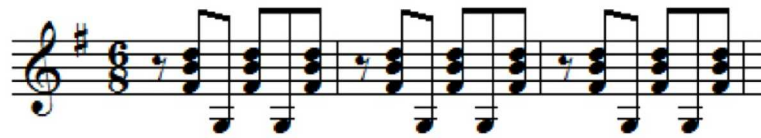
Fig. 9. Estructura rítmica de Bambuco.

La estructura rítmica de bambuco utilizada en el tercer movimiento es la siguiente: