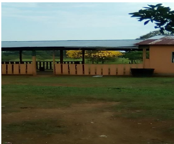
Figura 3. Institución educativa del resguardo indígena La Asunción.

El Resguardo Indígena La Asunción pertenece al municipio de El Retorno, que está a 40 kilómetros de la capital, San José del Guaviare. El Retorno es el centro poblado más cercano a la Inspección de La Libertad, a 7 kilómetros, en una vía aceptable en períodos de clima seco. Otra vía de acceso es el transporte fluvial por caño Grande, el cual es descartado por el costo en combustible para llegar al municipio de El Retorno (Alcaldía Municipal de El Retorno, Guaviare, 2018). Estas distancias y el estado de las vías no han impedido que en el Resguardo La Asunción exista una sede educativa que hasta el año 2018 perteneció a la Institución Indígena Morichal Viejo, en la cual se atienden a 14 niños que están en todos los grados de la educación básica primaria (de transición a quinto). La infraestructura de esta sede consta de dos salones y una cocina (ver figura 3).