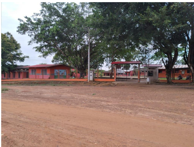
Figura 4. Institución Educativa La Libertad.