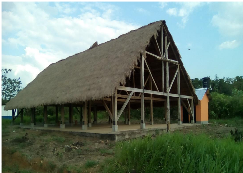
Figura 6 Maloca – Lugar de reunión del resguardo.

Por otra parte, para los campeonatos se invita a los habitantes de las veredas aledañas al resguardo, como lo son Caño Raya Alto, Caño Raya Bajo y Cachama. Para la inscripción se pide que cada equipo done una canasta de cerveza o el equivalente en dinero; luego los ganadores se reparten lo acumulado según los porcentajes: un 80% para el primer lugar, 15% para el segundo lugar y un 5% para el tercer lugar. En estos campeonatos no existen jueces; las pocas faltas que se cometen son sancionadas para todos incluyendo al infractor. Hay aquí un aspecto social de la visión sobre el conflicto: no es un individuo por aparte a quien se sanciona sino a todos, porque los individuos hacen parte de una comunidad y todos responden por ella.