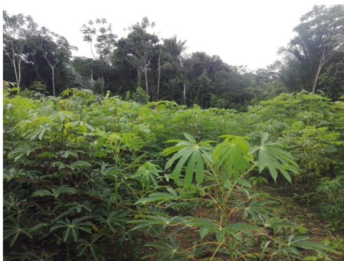
Figura 2. Chagra familiar.

Sin embargo, esta visión fue amenazada con el sofisma de la siembra de la coca, con propósitos comerciales, actividad agrícola que hace parte de la historia de esta comunidad que también fue bañada por el glifosato en el afán del gobierno por controlar lo que ellos consideran cultivos ilícitos. En la actualidad las pocas plantas de coca son utilizadas para el uso ancestral de la comunidad indígena y los cultivos que se desarrollan preferiblemente son de subsistencia: cultivos de yuca brava, yuca dulce, piña, ñame, maíz, caña de azúcar, ají, arroz, plátano y chontaduro; estos dos últimos productos solo en su etapa de producción más alta son comercializados. Entre los árboles frutales están la uva caimaron, el limón, las toronjas, las naranjas, el arazá y el aguacate (Ver figura 2).