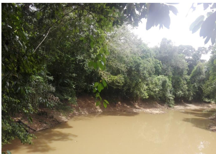
Figura 1 Paso de Caño Grande en verano hacia el Resguardo indígena La Asunción.