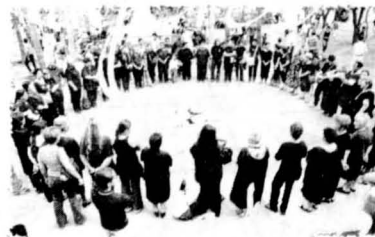
Mujeres de Colombia y del Mundo. Siglo XX-XXI. ♦