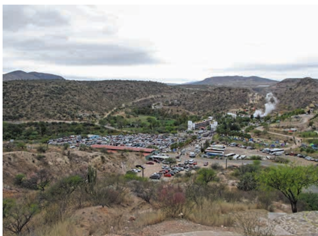
Figura 2. Vista de la carretera estatal para llegar al balneario. Fotografía de la autora, julio del 2015.

El vapor de agua del géiser sale del interior de la tierra a 95°C y alimenta al conjunto de albercas del balneario, de modo que las aguas de las albercas están a diferentes temperaturas: la más cercana al géiser a 80°C, y conforme se alejan del géiser se van enfriando, en medio están las tibias que son las más concurridas. Una vez que el agua está fría, se guía fuera del balneario y se reutiliza para regadío. (Testimonio de ejidatario, 71 años de edad)