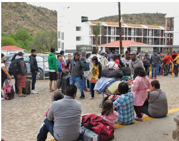
Figura 3. Periodo de alta afluencia al balneario. Fotografía de la autora, marzo del 2016.

La entrada a este balneario vale $120.00 (US$ 6.00) para el público en general, $60.00 (US$ 3.00) para las personas de la tercera edad y menores de 3 años, y existen descuentos del 10% en adelante para grupos que superen las 40 personas. La entrada al balneario es independiente de la zona de acampar, las cabañas y el hotel, es decir que el hospedaje no incluye la entrada al balneario. El precio del hospedaje varía desde $100 (US$5.00) por el espacio de tienda de campaña, hasta $2,000 (US$100.00) por una cabaña familiar. Las habitaciones del hotel van desde los $300 hasta los $1,500 (US$15.00 a US$75.00) según los lujos que se quiera disfrutar. Cabe mencionar que el hotel, las cabañas y los sitios para acampar están siempre al 100% de su capacidad durante fines de semana, días festivos y vacaciones. De lunes a viernes hay un promedio de 150 personas; en fines de semana el promedio es de 200 personas acampando, el hotel lleno y una asistencia rotativa de 2.500 a 3.000 personas que entran al balneario pero pernoctan en otro lado; en Semana Santa la asistencia llega a 35.000 personas (testimonio de ejidatario, 68 años de edad). En los periodos de mayor afluencia se puede observar largas filas de grupos de personas cargando objetos acuáticos, elementos para acampar, cobijas, estufas, comales, comida preparada y botanas que llevan en canastas, bolsas, hieleras, esperando su turno para ingresar al balneario (figura 3).