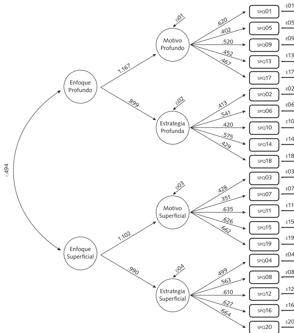
Figura 3. SPQ. Modelo jerárquico (J).

ya que valores altos en el primero y bajos en el segundo son interpretados como indicadores de mayor parsimonia. A esto debe agregarse que diferencias mayores entre los índices CAIC Independiente y CAIC Modelo también indican un mayor nivel de parsimonia. En este caso la diferencia resultó favorable para el modelo no jerárquico ortogonal (Tabla 2; Hooper, Coughlan, & Mullen, 2008).