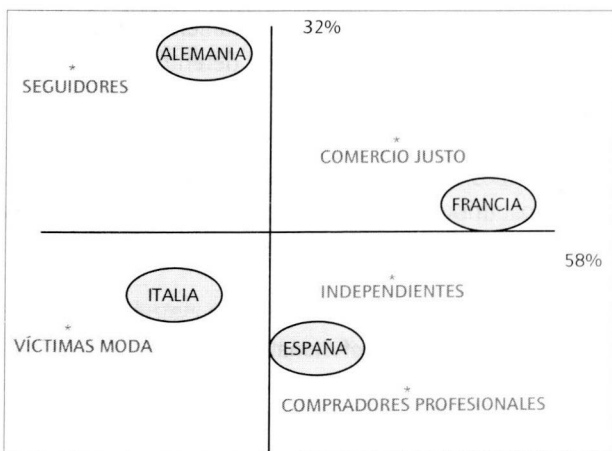
FIGURA 1. Composición de cada cluster atendiendo al país de origen

"independientes" presenta consumidores más o menos de todos los países por igual. Estos porcentajes se plasman visualmente en la figura 1, que sitúa cada país más próximo del cluster que mejor lo define. El "independiente" aparece en el centro de los ejes de coordenadas por su relevancia cross-cultural. En suma, como muestra la tabla 3, H2 debe ser rechazada, dado que la influencia de los ocho factores determinantes del proceso de compra varía en función del país, existiendo diferencias significativas entre los distintos países analizados (Chi2 = 52,12; P < 0,001). Esto es, los