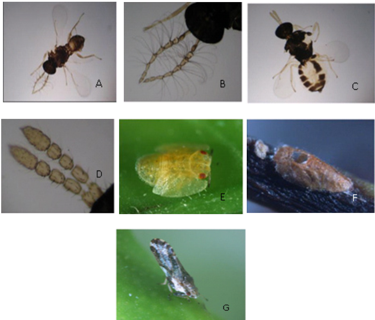
Figura 1. A. Adulto macho de Tamarixia radiata ; B. Antenas en macho; C. Adulto hembra de T. radiata ; D. Antenas de hembra en T. radiata ; E. Ninfa V de Diaphorina citri ; F. Ninfa V de D. citri parasitada-eclosionada por T. radiata ; G. Adulto de D. citri.

por Waterston (1922) y por Khan y Shafee (1981), como Tetrastichus indicus Khan y Shafee (Figura 2).