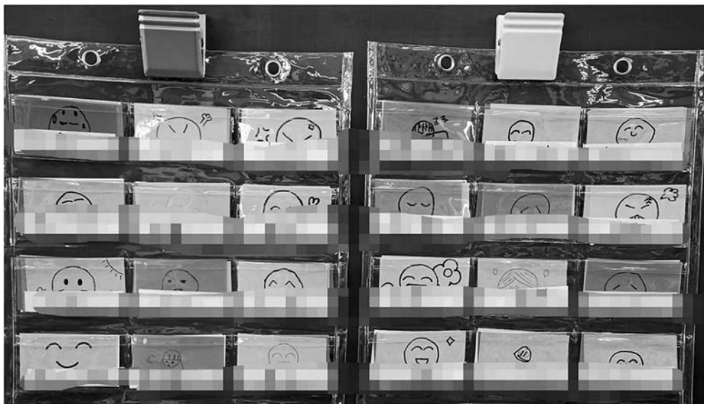
Figure 1 感情・体調共有ポケットチャート (児童の名前部分はぼかし加工をしている。)

感情・体調共有ポケットチャートの活用 感情・体調共有ポケットチャートは、教室前方の黒板横に研究期間中常時掲示した。カードの変更は、登校時や放課後、休憩時間など、授業時間以外であれば自分の感情・体調に合わせていつでも行ってよいこととした。カードの変更が自由に行われることを促すために、カードの変更が行われた場面で、学級担任はその理由を児童に問うことはしなかった。カードは学級児童全員が下校した後、学級担任がすべて「元気・ふつう」に戻し、登校時に朝の感情・体調に合わせて児童自身がカードを変更することとした。また、学級担任が児童の様子を見て、カードを変更することも行った。