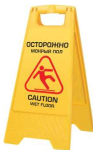
Рис. 1. Раскладной пластиковый предупреждающий знак

Мерами управления этим видом рисков являются использование переносных знаков, предупреждающих о мокрых скользких полах (рис. 1), и инструктаж работника. Минимизации риска служит и личная осторожность работника, использование обуви с противоскользящей подошвой.