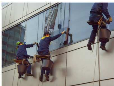
Рис. 3. Мойка окон производственного здания с использованием анкерных линий

Риски падения с высоты возможны по следующим причинам: мойка окон и фасадов снаружи здания, подъём на высоту при проведении мойки стен и оборудования. Меры управления рисками в данном случае включают использование СИЗ (временных ограждений, анкерных линий (рис. 3)), автоматизацию процессов (например, через форсунки идёт не сырьё, а чистящее средство).