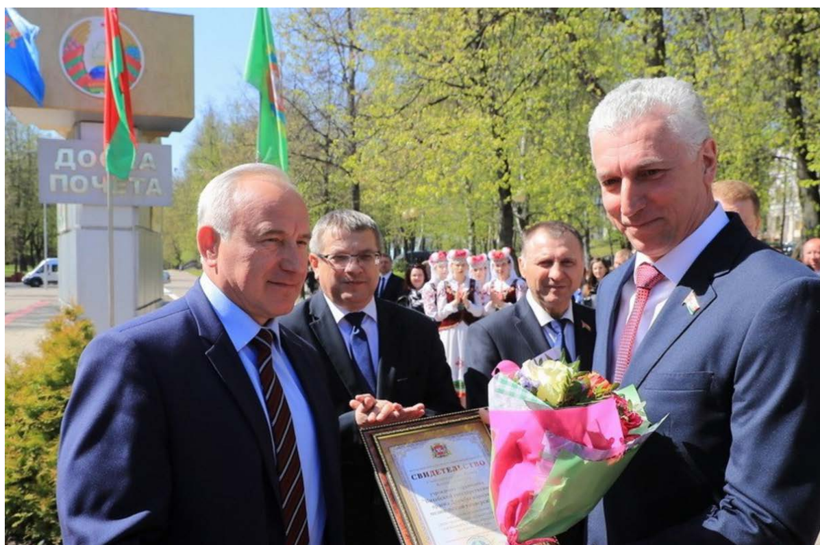
ВГМУ занесён на Доску почета Витебской области, 2019 г.