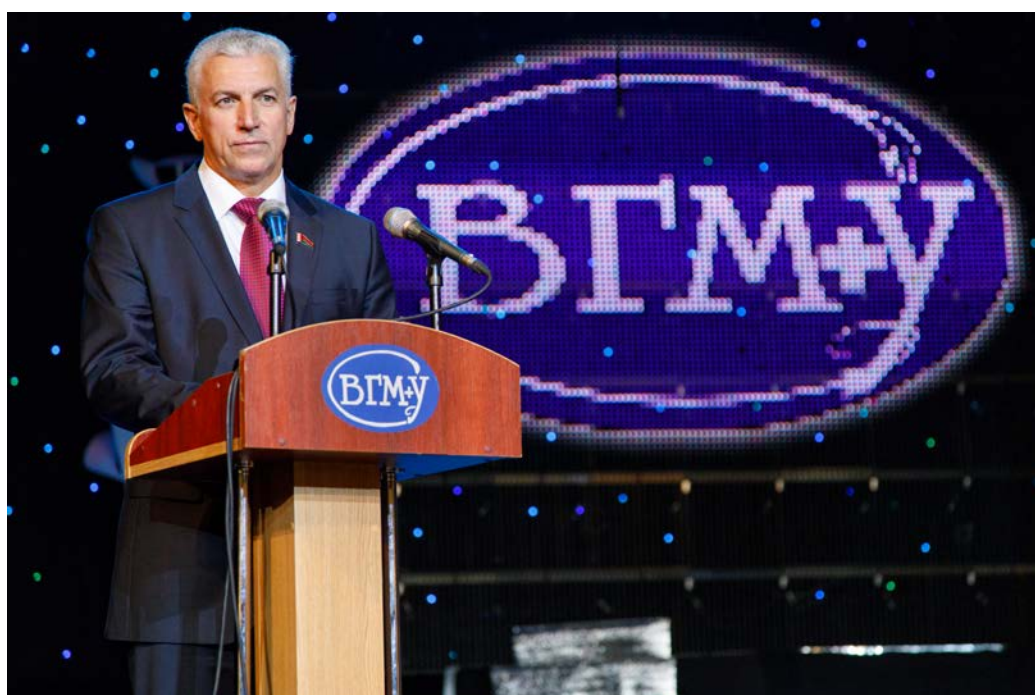
Торжественный Совет, посвящённый Дню знаний, в Концертном зале «Витебск»