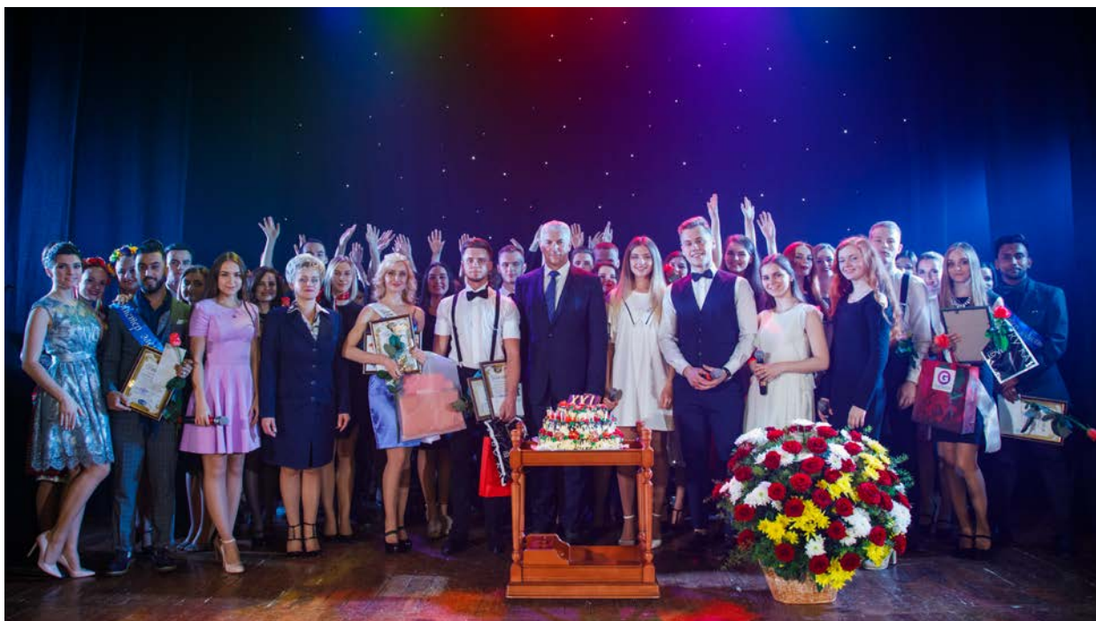
Заккрытие фестиваля «Студенческая осень-2017»