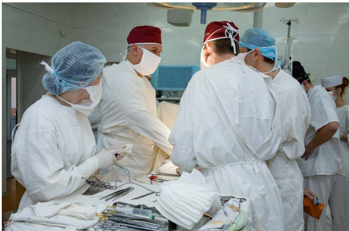
На операции в Витебской областной клинической больнице