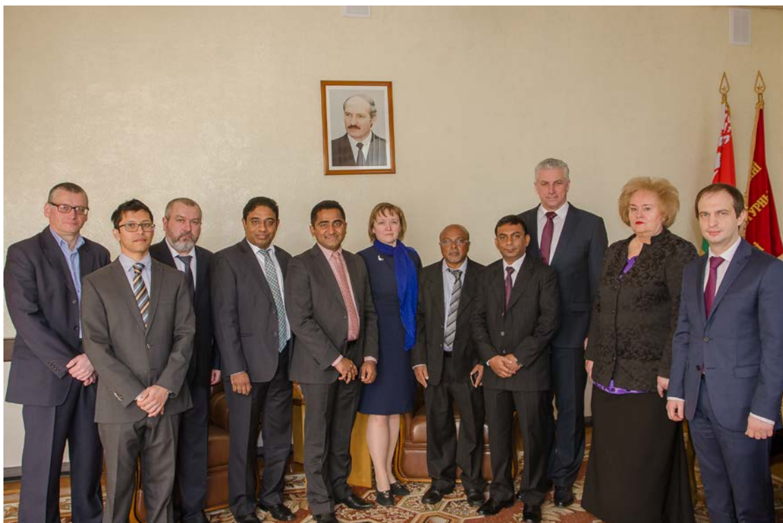
Приём делегации Медицинского и Стоматологического Совета Республики Мальдивы, 2016 г.