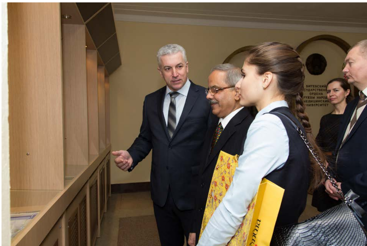
Приём Посла Республики Индия г-на Панкаджа Саксены, 2017 г.