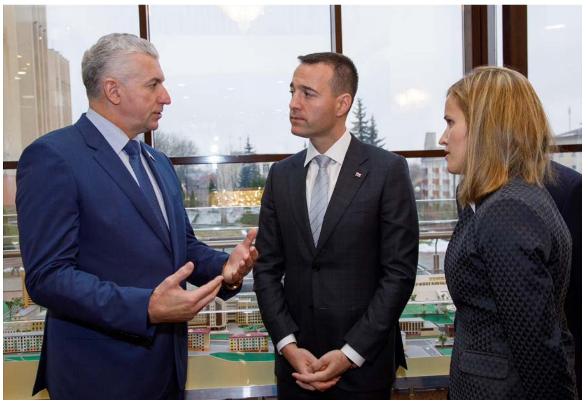
Приём делегации Министерства здравоохранения Словацкой Республики (Томаш Друкер, Министр), 2017 г.