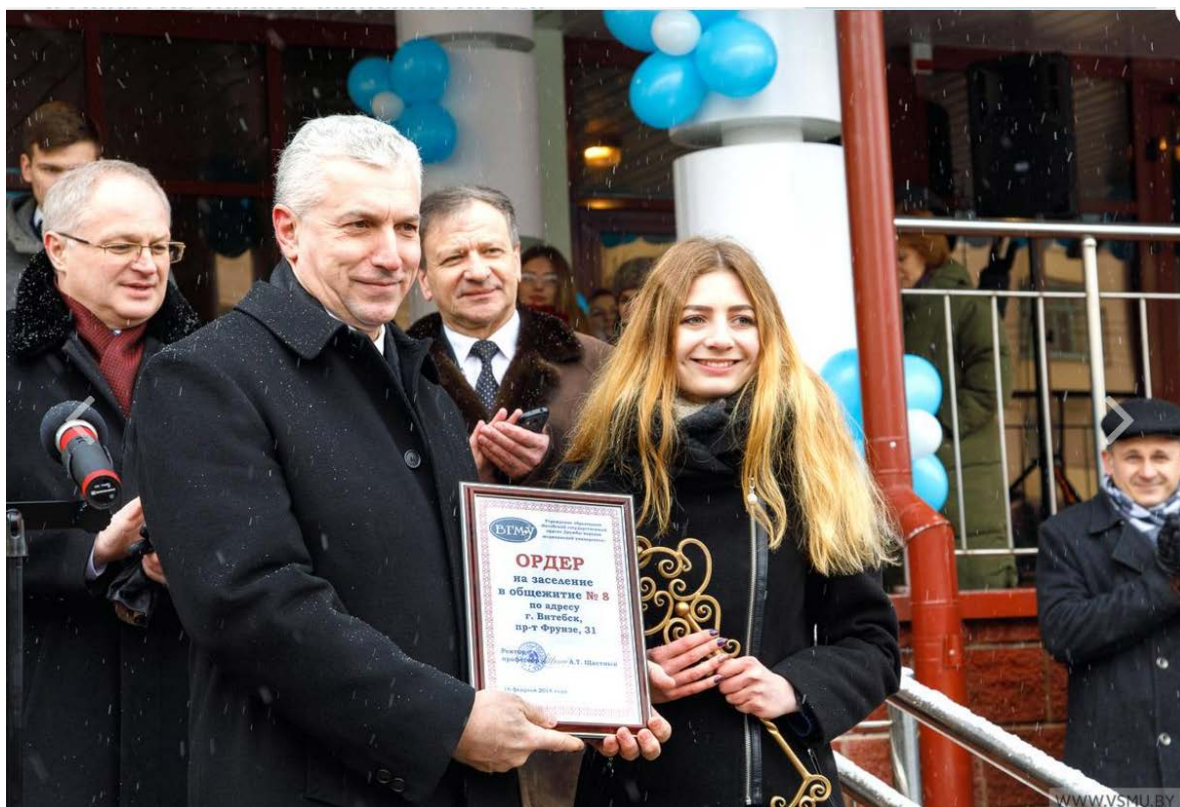
Вручение ордера и символического ключа студентам общежития № 8, 2018 г.