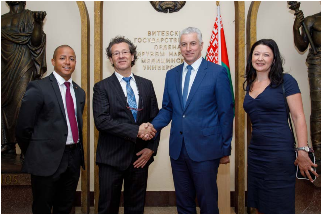
Приём делегации специалистов из группы университетских и исследовательских больниц Сан-Рафаэле и Сан-Дonato (Милан, Италия), 2018 г.