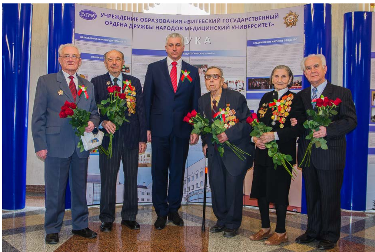
Ректор ВГМУ А.Т. Щастный с ветеранами, 2015 г.