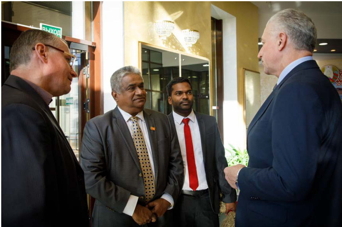
Приём делегации Министерства здравоохранения Демократической Социалистической Республики Шри-Ланка, 2019 г.