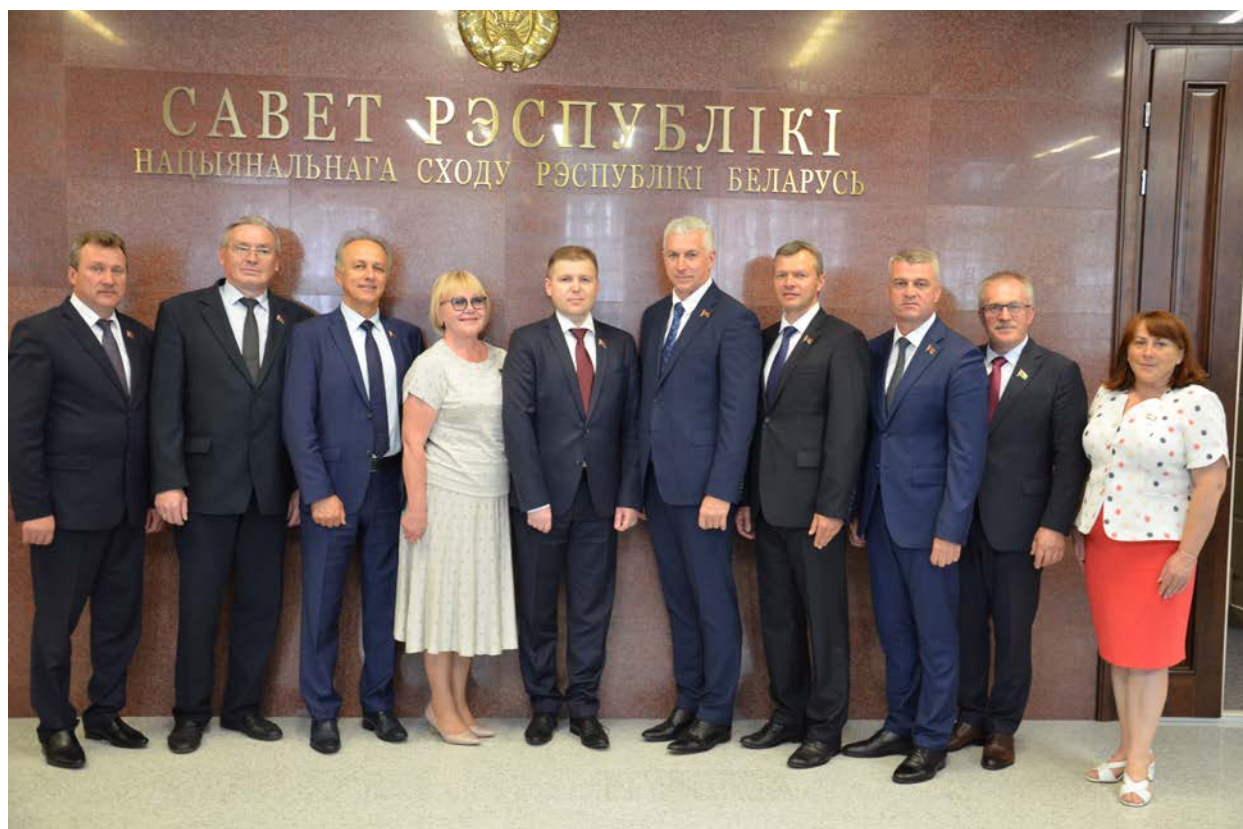
А.Т. Щастный – член Совета Республики Национального собрания Республики Беларусь, 2020 г.