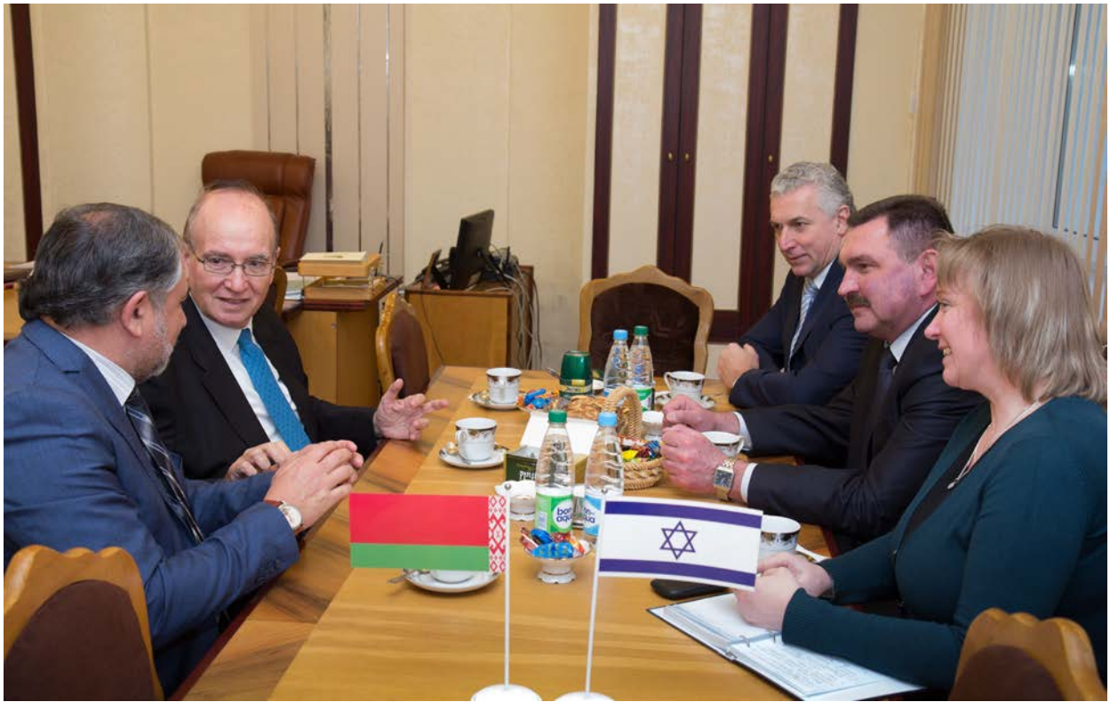
Приём Чрезвычайного и Полномочного Посла Государства Израиль г-на Дан Бен-Элиезер, 2015 г.