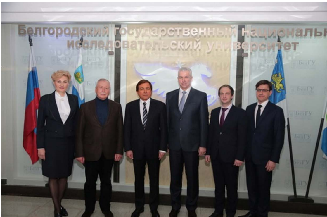
Посещение Белгородского государственного национального исследовательского университета (БелГУ), 2018 г.