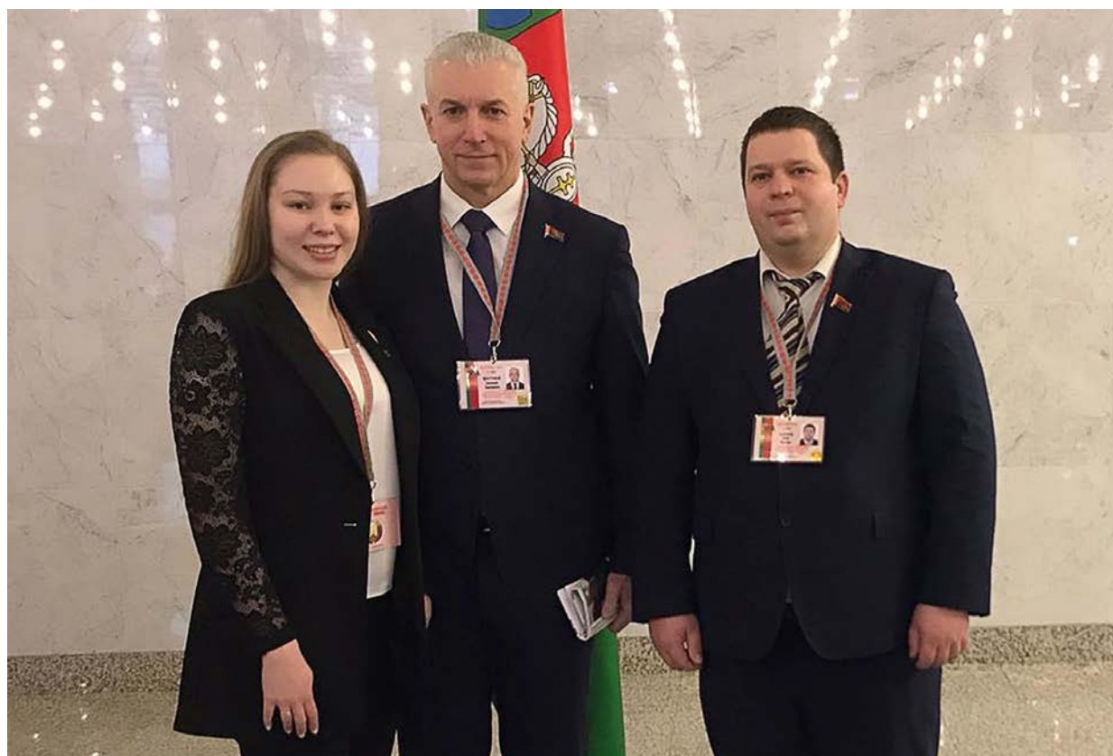
Делегация ВГМУ на VI Всебелорусском народном собрании, 2021 г.