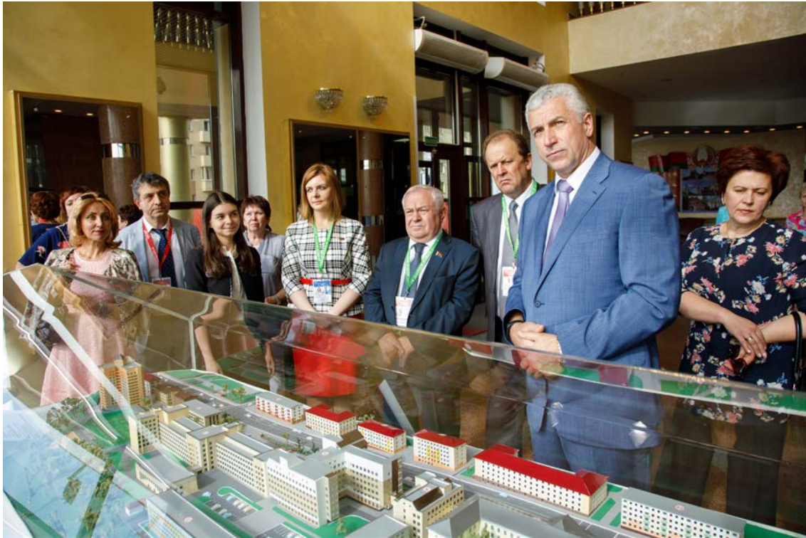
Приём межпарламентской делегации Республики Беларусь и Российской Федерации, 2017 г.