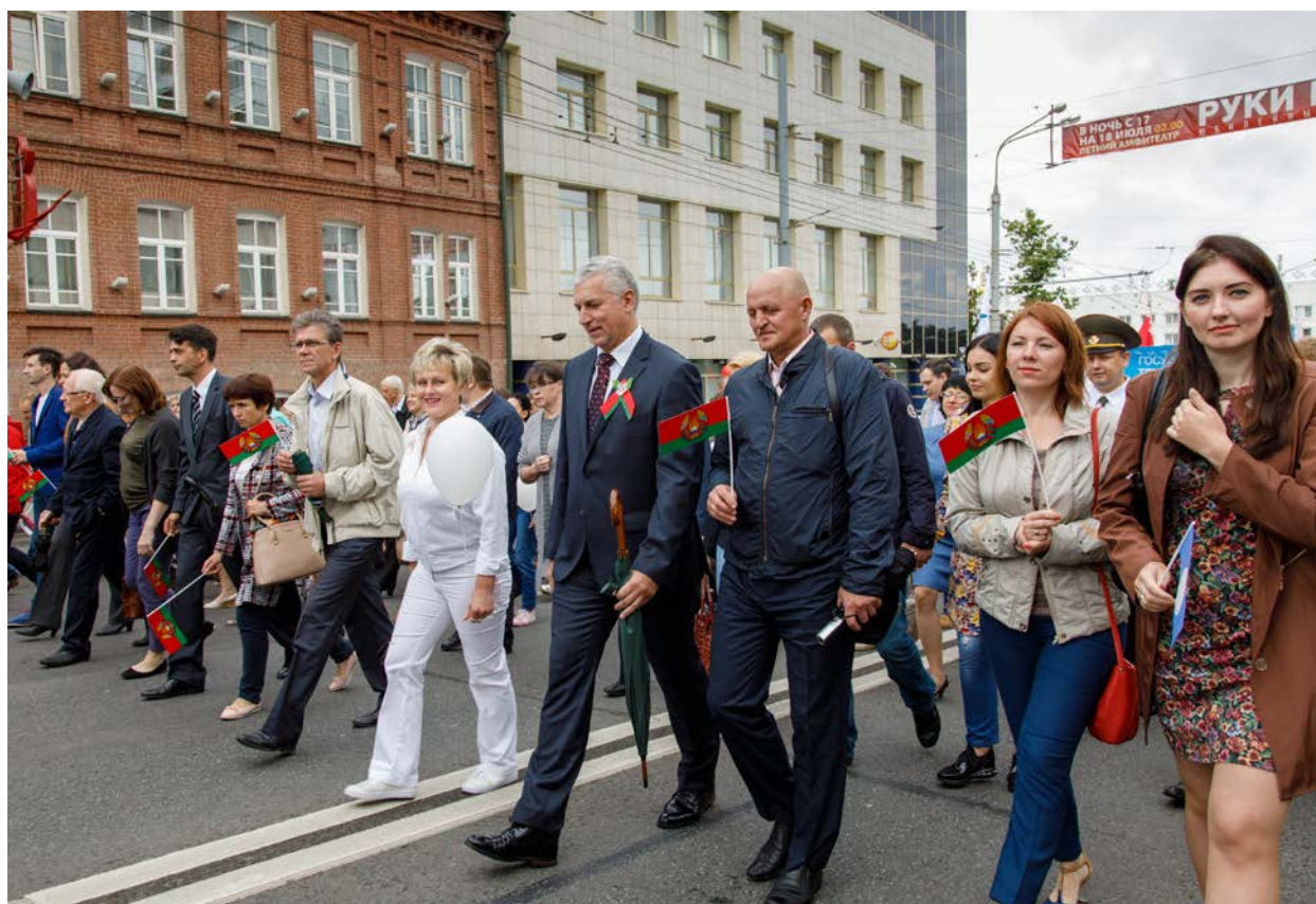
День Независимости Республики Беларусь, 03.07.2017 г.