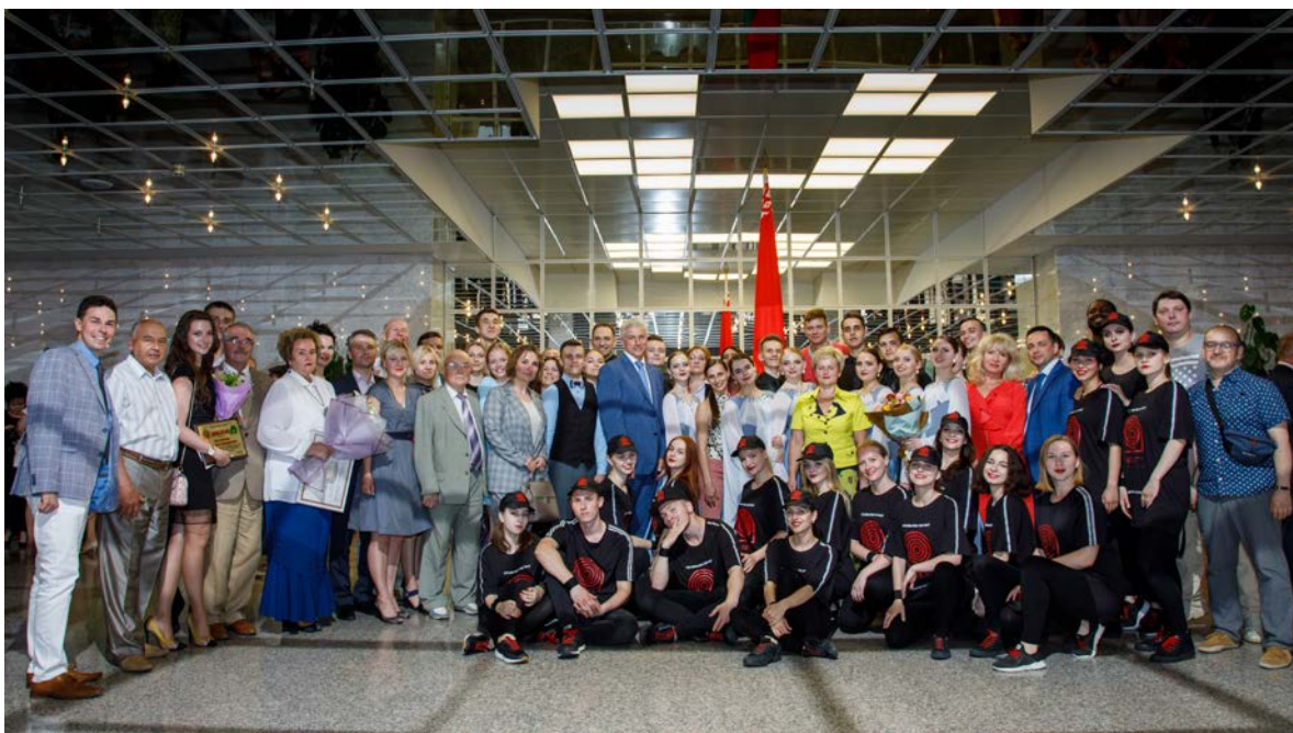
ВГМУ вместе!!! 100-летие белорусского здравоохранения, г. Минск, Дворец Республики, 2019 г.