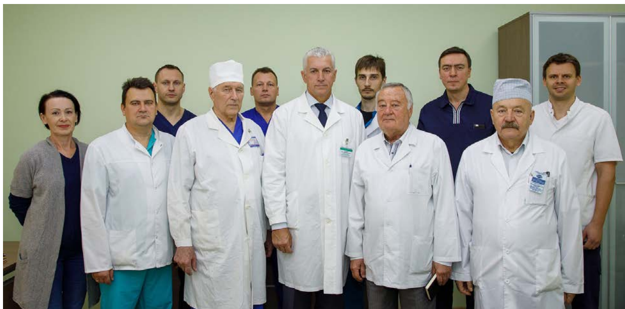
Кафедра хирургии ФПК и ПК, октябрь 2008 г.