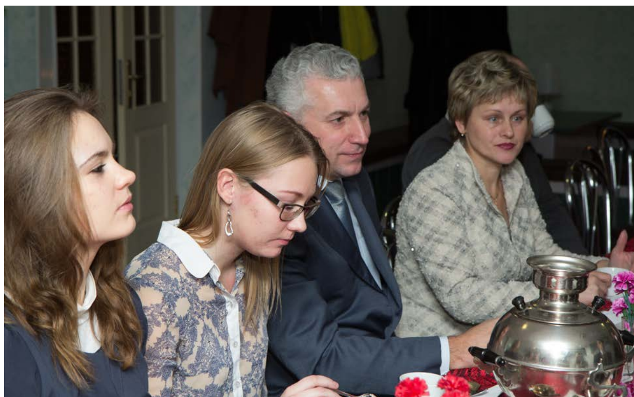
На встрече с INFINITY DANCE GROUP, 2016 г.