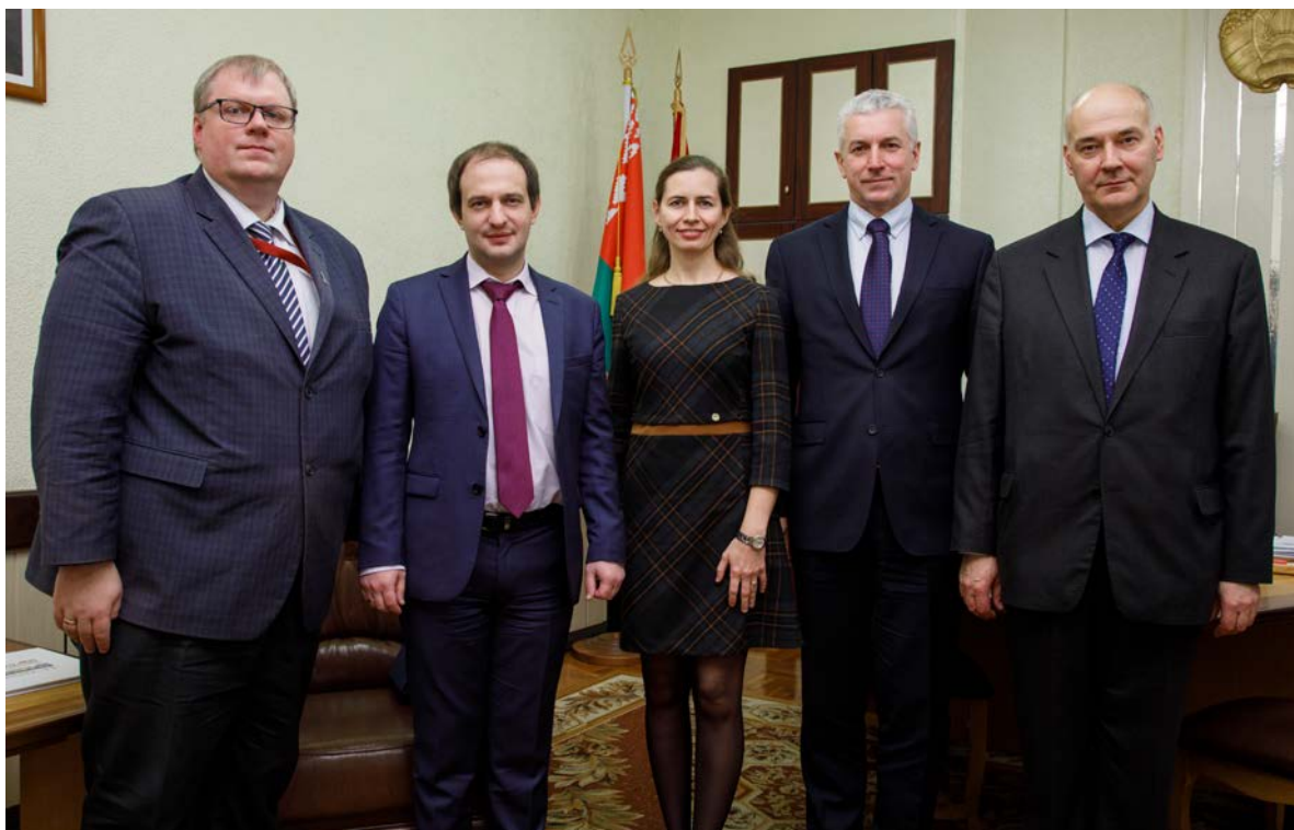
Приём Председателя Совета высшего образования Латвийской Республики, 2017 г.