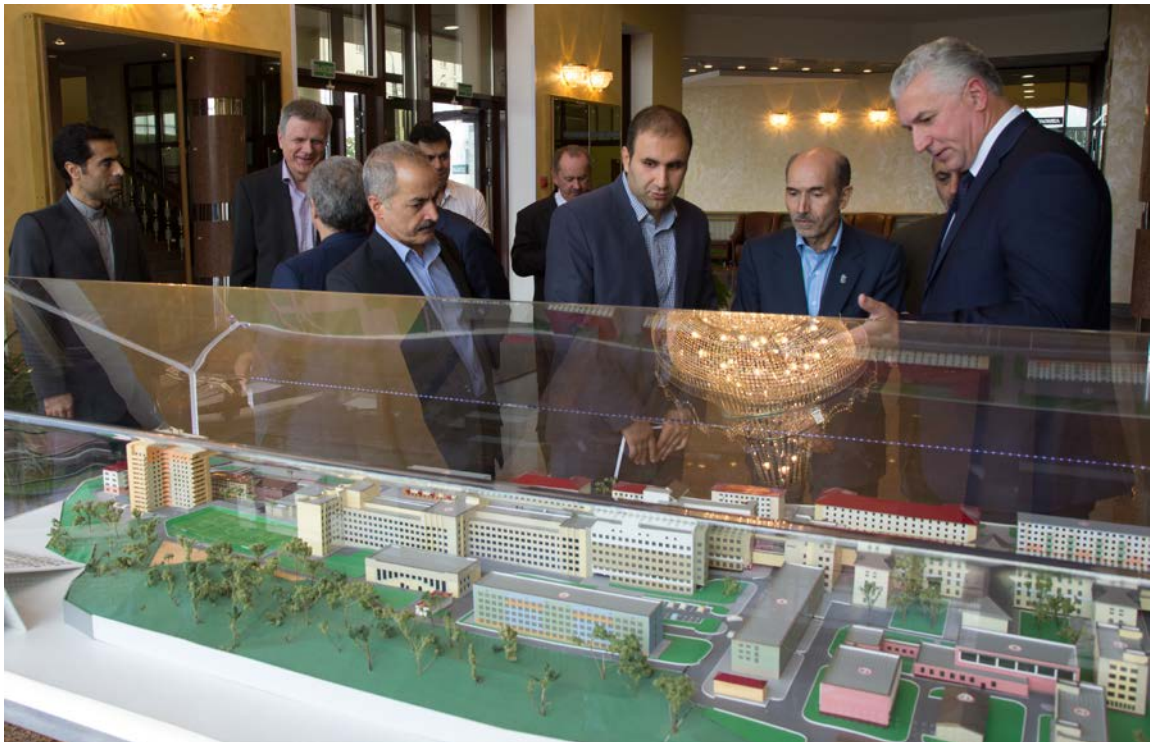
Приём делегации Тегеранского университета (Исламская Республика Иран), 2016 г.