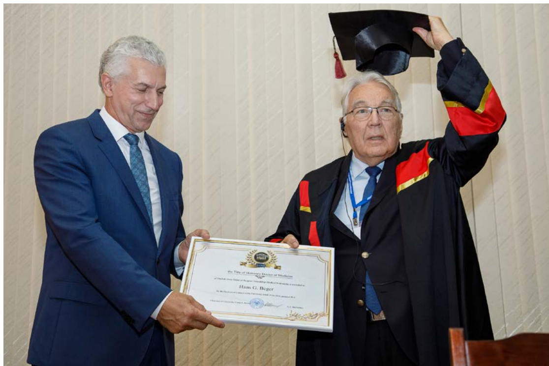
Приём профессора Университетской клиники Ульм (Германия) Ханса Гюнтера Бегера, 2019 г.