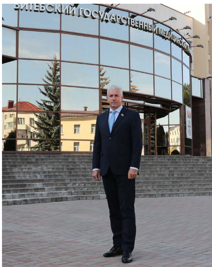
На фоне лабораторно-теоретического корпуса университета