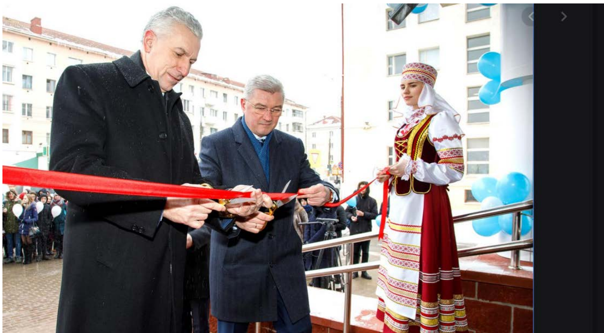
Торжественное открытие студенческого общежития ВГМУ № 8, 2018 г.