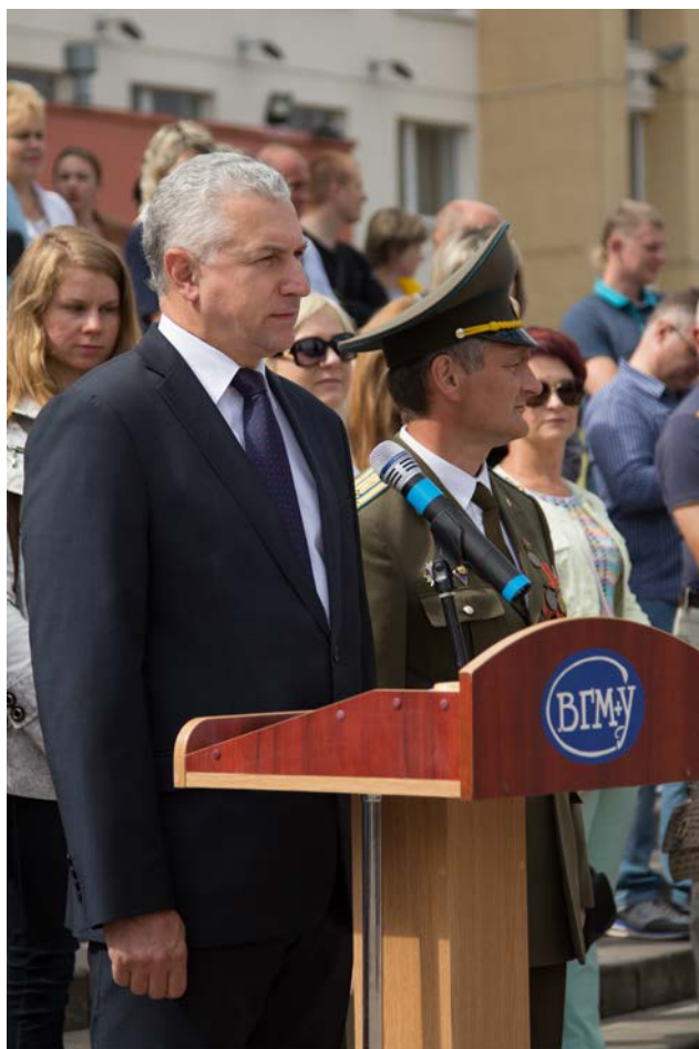
Принятие Присяги, 2017 г.