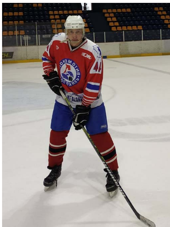
На ледовой арене