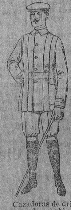
Cazadoras de dril crudo o kaki, de ptas. 12 a 20. Pantalones cortos para sportman, de dril beige, de ptas. 8 a 12.