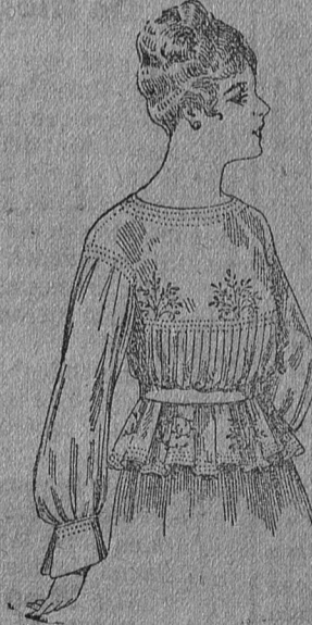
Blusa de ruspón de seda, en negro, azul y colores, de ptas. 33 a 35.