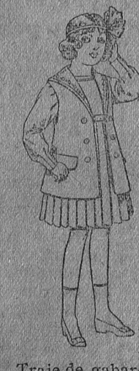
Traje de gabardina blanco, cuello de organdín bordado, para niñas de 4 a 9 años, de ptas. 22 a 24.