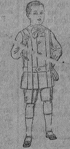
Trajes de lanilla para niños de 4 a 9 años, de ptas. 12 a 33.