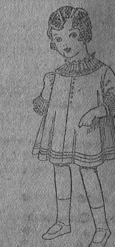
Vestido de voile blanco bordado, de ptas. 6'75 a 8.

Gorras, sombreros de paja, calcetines, corbatas, fajas, ligas, tirantes, pañuelos, etc.