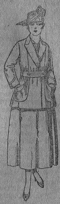
Traje de estambre negro, azul y color, de ptas. 70 a 75.