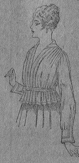
Blusa batista blanca, a ptas. 5/75.