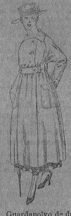
Guardapolvo de dril beige, manga «Ragland», a ptas. 23.