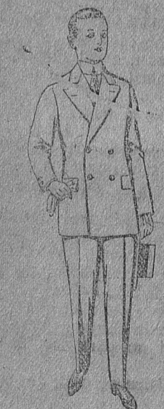
Traje de estambre, vicuña o jerga, para jovencitos de 10 a 16 años, de ptas. 19 a 50.