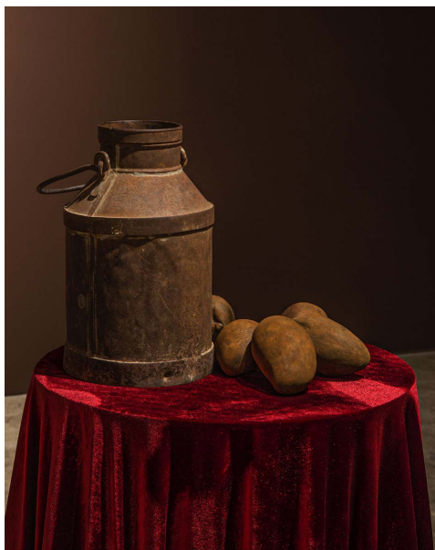
Figura 1 · Lorena D’Arc, Manga com leite, 2015, cerâmica, ferro, manga e arquivo sonoro. Dimensões variadas.