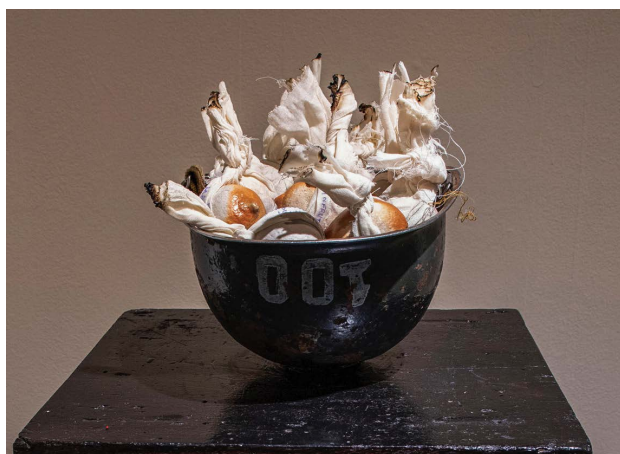
Figura 5 · Marta Strambi, Molotove-me, objeto/ performance, 2019, porcelana, tecido, capacete militar e suporte de madeira, 110 cm x 40 cm x 40 cm.