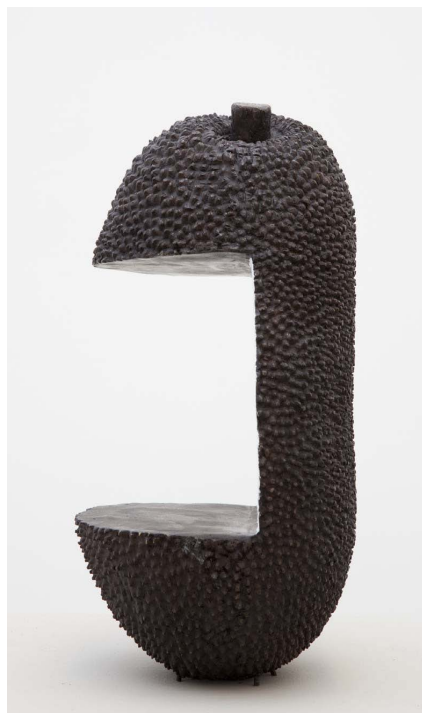
Figura 3 · Erika Verzutti, Brasília TV, 2011, bronze e tinta acrílica, 32 x 21 x 17cm.