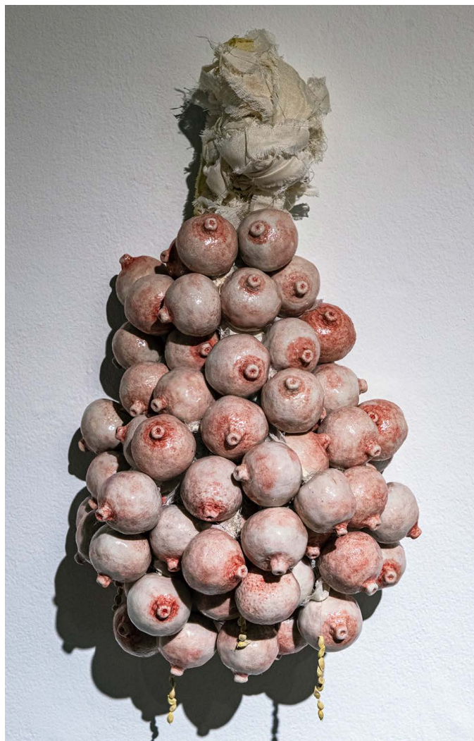
Figura 7 · Marta Strambi, Infrutessência, 2019, porcelana, tecido e sementes de tangerina, 70 cm x 40 cm x 30 cm.