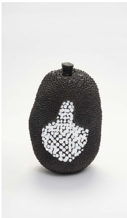
Figura 4 · Erika Verzutti, Brasília Pintura, 2019, bronze e óleo, 42 x 25 x 25cm.