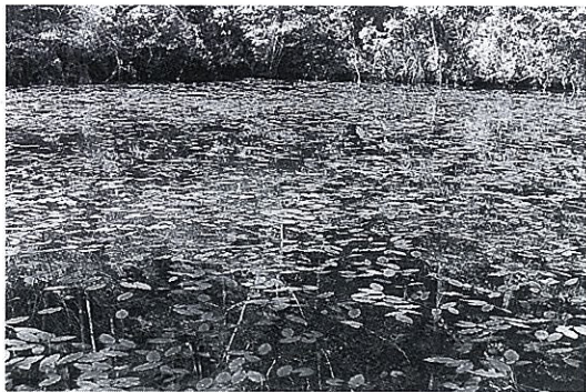
FIG. 1. Potamogeton fryeri community in Mizunira Pond. Pond water was clear and submerged leaves of P. fryeri could be seen from shore. (13 October 1982)

近くの表層水の水質を測定した。透視度はプラスチック製の自作器具、電気伝導度は電気伝導度計 (DKK model HPK-22, 水温 25°C換算), pHはガラス電極法 (YEW model pH 81) により現場で測