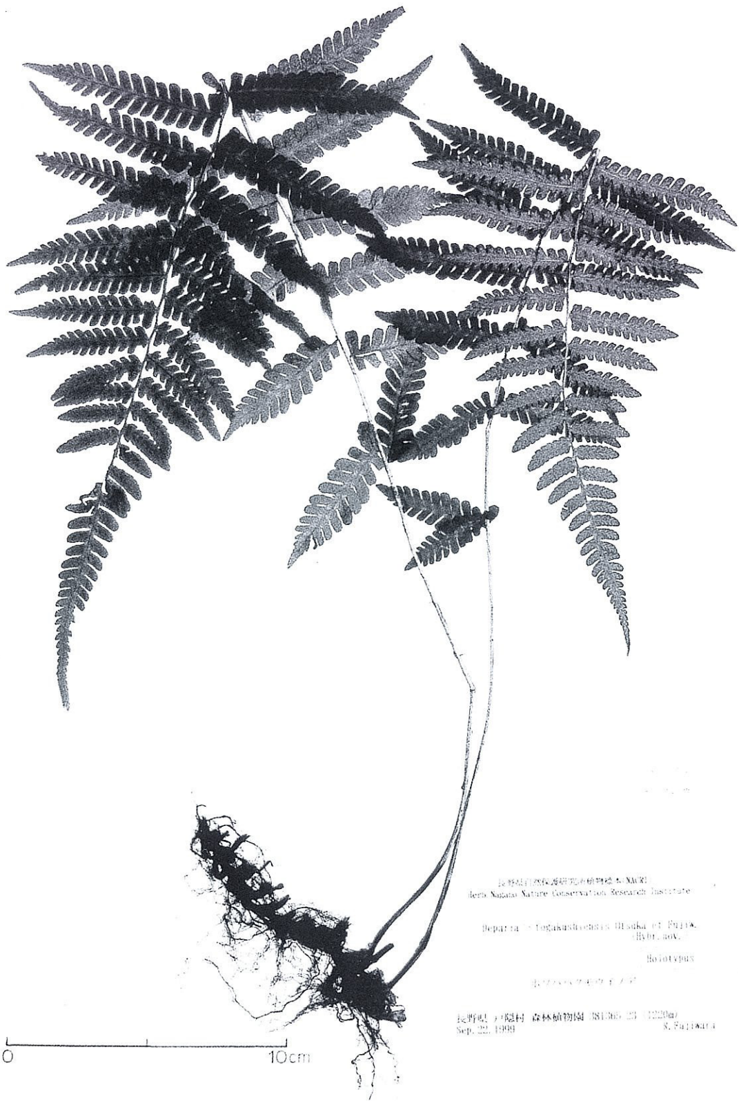
Fig. 4. Holotype of Deparia \times togakushiensis Otsuka et Fujiw.