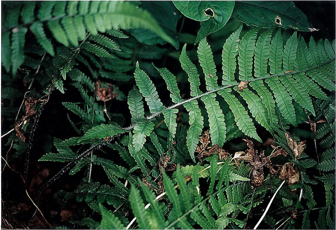
Fig. 3. Vegetative sporophylls of Deparia Xtogakushiensis (Togakushi Botanical Garden of Forest in Nagano Prefecture, Jun. 13, 1999).