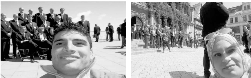
Abbildung 2: ‚Selfie‘ mit Innenminister_innen 2006 (links) und 2018 (rechts)

Interventionen in den symbolischen Raum der Innenminister und deren machtvolle Inszenierungen haben sich seit den ersten JoG-Konferenzen in Garmisch und Nürnberg als Aktionsstrategie etabliert. Beispielhaft ist die Aktion eines JoG-Aktivisten, dem es 2006 gelungen war, an den Ort des Fototermins der Innenminister auf der Zugspitze vorzudringen und sich selbst, sichtlich amüsiert, vor diesen zu fotografieren. Über zehn Jahre später wird die Szene bei der JoG-Konferenz in Sachsen-Anhalt wiederholt (siehe Abbildung 2).