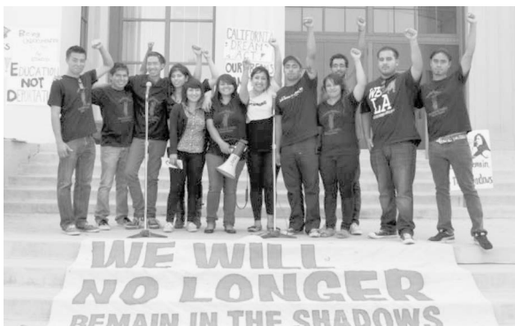
Abbildung 1: Coming out of the Shadows im Rahmen eines Workshops