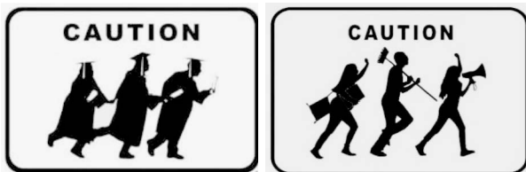
Abbildung 3: Logo von Orange County Dream Team (links) und Orange County Immigrant Youth United (rechts)