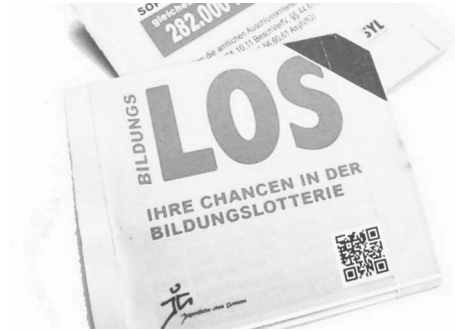
Abbildung 4: Bildungs-Lose zur JoG-Kampagne Bildung(s)Los!