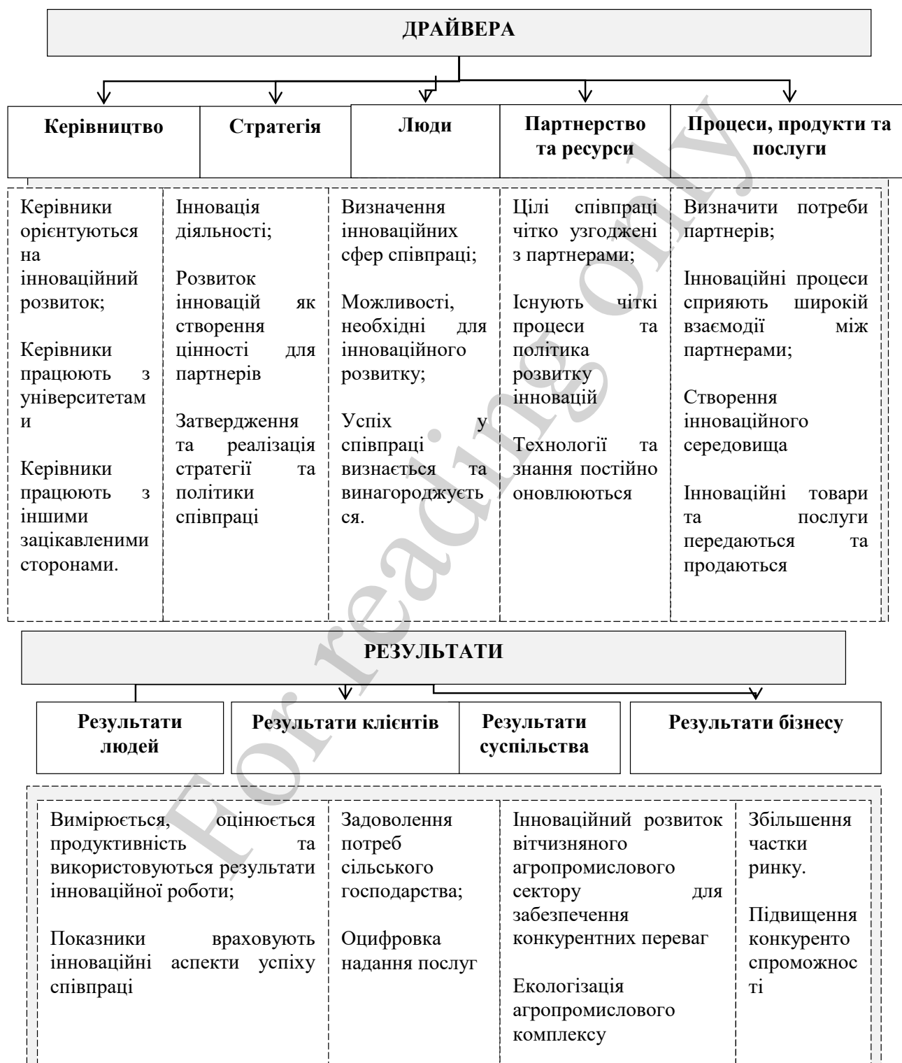
Рис. 3. Інноваційний драйвер розвитку сільськогосподарського машинобудування

Для об'єктивної ідентифікації ключових факторів, що впливають на розвиток інноваційних процесів у сільськогосподарському машинобудуванні, в ході дослідження сформовано перелік показників, які дозволяють якісно та кількісно оцінити стан галузі, вирішити проблеми.