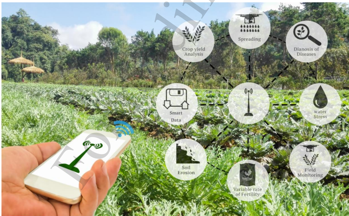
Рис. 1. Попит на їжу зростає на 70 % до 2050 року [3]

Впровадження штучного інтелекту (artificial intelligence) в агроecosистему використовується в першу чергу для усунення людського праці в рутинних сільськогосподарських процесах (рис. 1). Це також забезпечить автоматичне визначення, діагностики і класифікації хворих і здорових рослин.