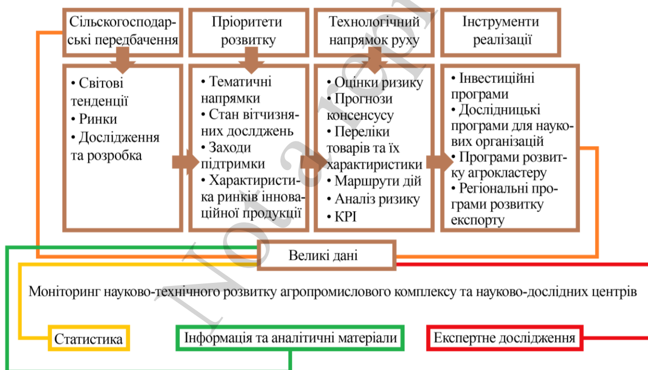
Рис. 5. Дорожня карта реалізації вдосконаленого розвитку харчової промисловості

Додатковим стимулом для підприємств і держави має стати реалізація національних проєктів, дорожні карти реалізації яких ставлять дуже амбітні завдання: від експорту сільськогосподарської продукції на суму $ 45 млрд, починаючи з 2024 р., до збільшення частки інноваційно активних компаній до 50 %. Виходом із цієї ситуації може стати сформований розвиток системи науково-технічного прогнозування та планування, який може бути реалізований не тільки на рівні всієї галузі, але і в одній компанії (рис.5).