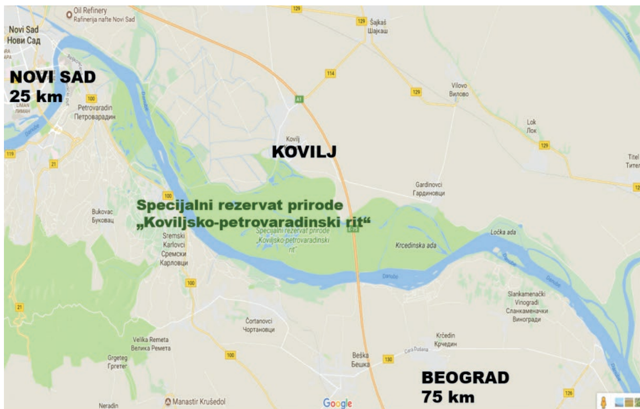
Slika 1. Specijalni Rezervat Prirode "Koviljsko-Petrovaradinski rit" – geografski položaj i rasprostiranje Figure 1. Special Nature Reserve "Koviljsko-Petrovaradin Rit" – geographical location and distribution

našume, koje je tržišno i profitno orijentirano (Stevanov, Krott, 2013). U selu Kovilj nalazi se Manastir Svetih Arhangel, što obogaćuje okolinu samog Rita koji se prostire na teritoriju četiri političke općine – Novi Sad, Indija, Sremski Karlovci i Titel. Prema Uredbi o proglašenju (Sl. glasnik 44/11) Rit je podijeljen na tri stupnja zaštite: prvi stupanj obuhvaća 373 ha (6%) stroge zaštite; drugi stupanj 1.738 ha (29%) je pod mjerama aktivne zaštite; u trećem stupnju 3.784 ha (65%) moguće je gospodariti šumama bez ograničenja (Panjković et al., 2010; POG – Posebne Osnove Gospodarenja šumama).