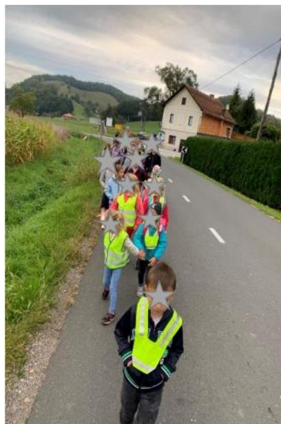
Slika 3: Svi pješice u školu

Također smo ustanovili da ih pritom ne ometaju teške torbe pošto u učionici imamo ladice za školske potrepštine. Učenici nose kući samo potrepštinu u kojoj je domaća zadaća. Učenici su dosljednije pregledavali što je zaista potrebno u njihovoj torbi (teška torba nije prijatna na leđima kod pješičenja).