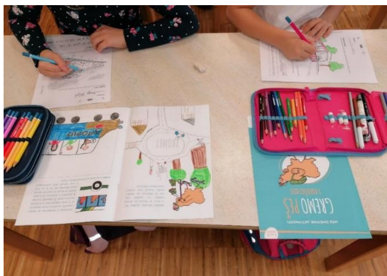
Slika 2: Dnevnik aktivnosti Idemo pješice s kokoši Rozi i rješavanje radnog lista