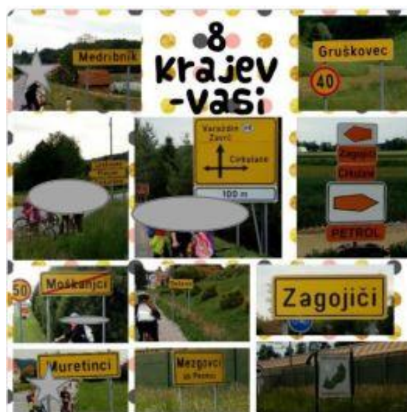
Slika 4: Biciklistički sportski dan (proveden na daljinu)

Nakon slanja dokaza o izvođenju sportskog dana (fotografije, zapisi utisaka učenika i roditelja) bilo je vidljivo da su sudionici veoma uživali u aktivnostima, stjecali su biciklističke spretnosti, a mlađi učenici su se uz pratnju odraslih navikavali na sigurno uključivanje u promet.