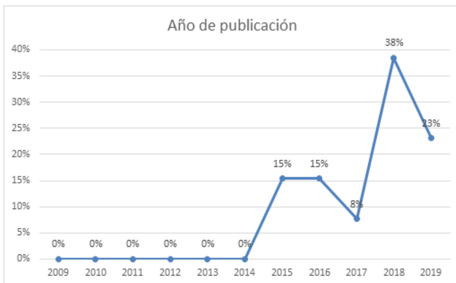
Figura 2. Porcentajes de artículos por año de publicación