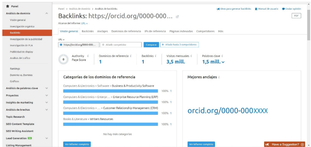
Figura 2. Datos de tráfico del perfil analizado en ORCID. Fuente: propia (segundo trimestre de 2020).

Efectivamente se constata la afirmación de Sulé Alonso y Prieto García (2010) cuando señalan que las posibilidades de encontrar a un usuario tipo en la Red en este caso a usuarios interesados en las temáticas abordadas por nuestro sujeto de estudio para incrementar el volumen de citas recibidas a sus trabajos de investigación son significativas. El volumen de visitas a los perfiles abiertos, es impensable en el mundo analógico.