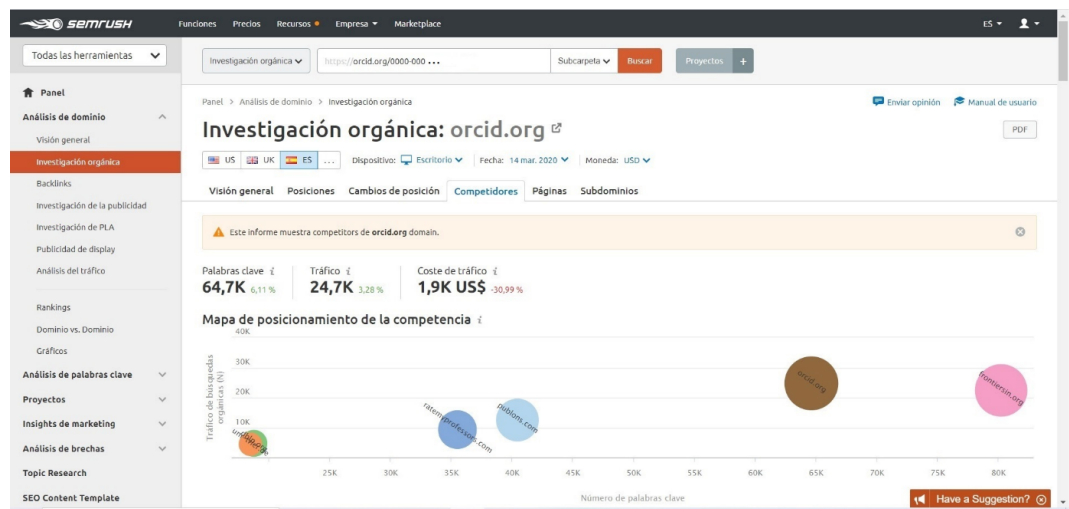
Figura 4. Principales competidores de ORCID en dato SemRush. Fuente: propia (segundo trimestre de 2020).