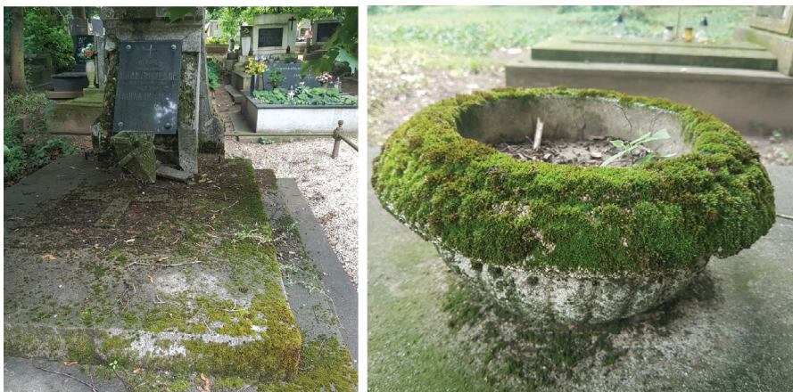
1. ábra. A régi, elhanyagolt sír építmények gyakran ideális mohaélőhelyek.

A kutatási területen közel 8000 sírhely található. A sírok többnyire ápolts, viszonylag új síremlékek, melyek többsége sima felszínű műkőből és márványból készült.