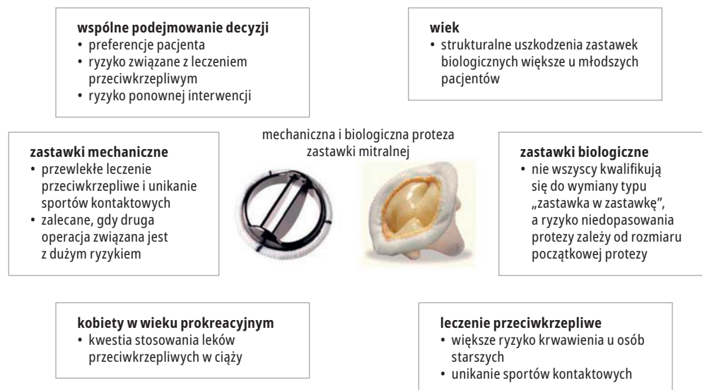
RYCINA UZUPEŁNIAJĄCA 2. Czynniki, które należy wziąć pod uwagę przy wyborze protezy zastawkowej u osób uprawiających sport wyczynowy

niczna) jest wyższa niż w przypadku ogólnej populacji osób w podobnym wieku, które nie zostały poddane operacji. 136 Wewnętrzne właściwości protez zastawkowych skutkują mniejszym efektywnym obszarem ujścia w porównaniu z zastawką naturalną, dlatego gradienty przezastawkowe są zwykle większe. Duża pojemność minutowa serca występująca podczas wysiłku fizycznego może potencjalnie powodować dalsze zwiększenie gradientów przez protezę. Ponadto u niektórych pacjentów rozmiar protezy może nie być odpowiedni w stosunku do wielkości ciała, co powoduje niedopasowanie protezy zastawki do pacjenta. Wszystkie te czynniki należy wziąć pod uwagę podczas zalecania ćwiczeń osobom z protezą zastawkową. Ocena osób z protezami zastawkowymi jest taka sama jak w przypadku osób z zastawkami natywnymi, chociaż zaleca się wykonanie dodatkowej echokardiografii wysiłkowej. 137 Zalecenia dotyczące wykonywania ćwiczeń są uzależnione od wydolności czynnościowej, prawidłowej odpowiedzi hemodynamicznej i oceny protezy zastawkowej podczas wysiłku. 138