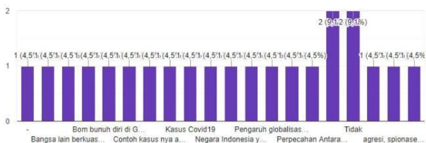
Gambar 4. Rekapitulasi Google Form

Dan contoh kasus mengenai sistem pertahanan nasional yang ada di Indonesia amat sangat banyak hal itu dapat kita lihat dari contoh-contoh kasus yang mahasiswa isi di Google Form yang telah saya buat. Kita bisa lihat contoh-contoh kasus yang terjadi di Indonesia yang mahasiswa ketahui, ada pada gambar 3.