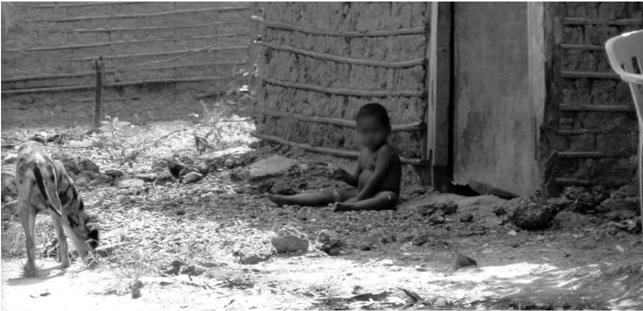
Jugando en el patio. Cartagena 2011.