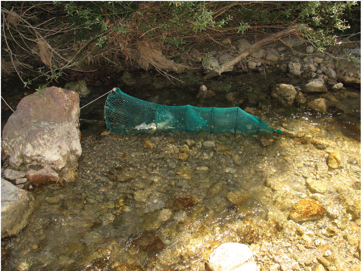
Esempio di nassa utilizzata per il campionamento ittico.

sportiva) che di tipo “bertovello” o “martavello” a chiudere tratti di torrente di moderata larghezza e profondità. Le nasse sono state calate ed appoggiate sul fondale, nelle acque di media profondità (circa 1 m) e lasciate in posa tutta la notte per essere poi controllate la mattina seguente. Nei punti a maggior profondità e a corrente moderata è stata impiegata una rete a bilancia manuale.