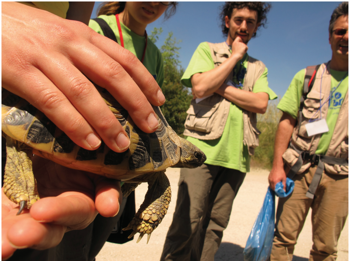
Esemplare di Testuggine di Hermann ( Testudo hermanni ) catturato durante il BioBlitz.

Tutte le altre specie osservate risultano inserite in allegati della Direttiva Habitat e/o in quelli della L.R. 56/2000. Si tratta di: Ramarro ( Lacerta viridis bilineata ), Natrice dal collare Elvetica ( Natrix helvetica )*, Lucertola muraiola ( Podarcis muralis ), Lucertola campestre ( Podarcis siculus ), Geco comune ( Tarentola mauritanica ). Il Biacco ( Hierophis viridiflavus ) e la Vipera comune ( Vipera aspis ) non si ritrovano negli allegati sopra menzionati e sono entrambi inseriti nella categoria a “Minor Preoccupazione” (LC). Il campionamento di queste due specie, risulta altrettanto interessante poiché, fa sperare in una discreta consistenza nu-