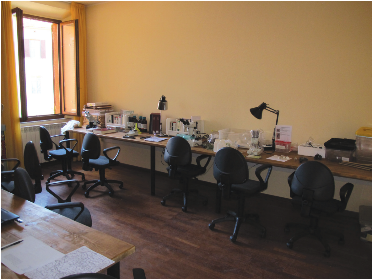
Postazioni per l'identificazione delle specie allestite presso il Campo Base.

Esaminando parti morte di legname (rami e/o tronchi) è stata effettuata una ricerca attiva di larve di specie xilofaghe.