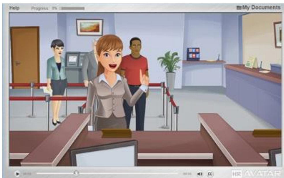
Figura 3. Jugando con HR Avatar