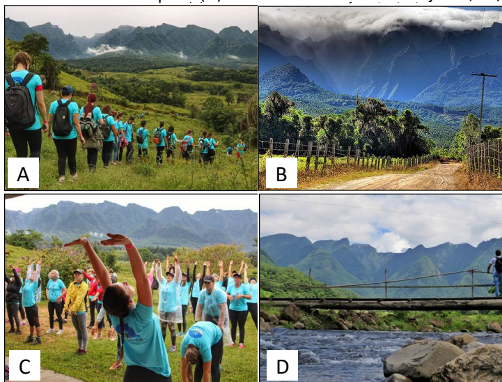
Figura 3 – (A e C) Mulheres na montanha se exercitando. (B) Vista ao fundo do Parque Nacional de São Joaquim. (D) Pontilhão sobre o rio Laranjeiras, 17/03/2019