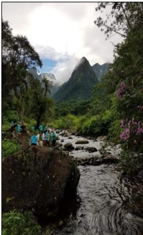
Figura 2 – Mulheres na montanha circundando o rio Laranjeiras, 17/03/2019