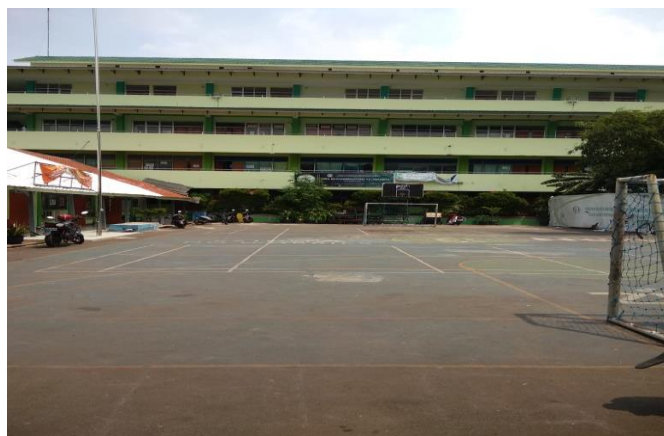
Gambar 1. Lokasi Mitra SMA Muhammadiyah 12 Jakarta

Dalam memproduksi dan memasarkan sabun ramah lingkungan diperlukan pengetahuan tentang permasalahan lingkungan hidup itu sendiri dan cara membuat produk sabun herbal ramah lingkungan menggunakan metode yang sederhana. Melalui Program Pengabdian pada Masyarakat bertajuk Program Kemitraan Masyarakat (PKM), para dosen dari Program Studi Fakultas Farmasi dan Sains Universitas Muhammadiyah Prof. DR. Hamka akan memberikan pengetahuan tentang masalah lingkungan yang melandasi diciptakannya suatu produk sabun herbal ramah lingkungan, disertai formulasi sabun herbal yang berbahan dasar tanaman obat. Mitra, yaitu Sekolah Menengah Atas Muhammadiyah 12 (Gambar 1), yang memiliki kegiatan market day setiap bulannya adalah lokasi yang tepat untuk pelaksanaan Program Pengabdian Masyarakat Dosen UHAMKA. Sebagai peserta, siswa-siswi SMA Muhammadiyah 12 ini nantinya akan melengkapi produk ini dengan strategi pemasaran dan perhitungan cash flow yang akan membuat produk ini dapat dijual di masyarakat.