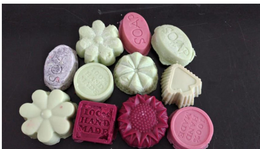
Gambar 4. Hasil Pembuatan Sabun

Melalui program ini terlihat hasil pre-test dan post-test yang menunjukkan adanya peningkatan pengetahuan peserta dalam memahami materi workshop. Hal tersebut terlihat dari peningkatan nilai yang diperoleh pada pre-test dan post-test (Gambar 2 dan 3). Dengan demikian, diharapkan materi ataupun informasi yang telah diberikan dapat dipahami dan dapat diaplikasikan oleh peserta dalam kehidupan bermasyarakat, baik di lingkungan keluarga, sekolah ataupun masyarakat. Sebagai reward, lima peserta dengan nilai post-test nilai terbaik mendapatkan hadiah soap making kit yang dikirim ke alamat rumah masing-masing. Peserta yang bertanya juga mendapat souvenir yang dikirim ke alamat rumah masing-masing.