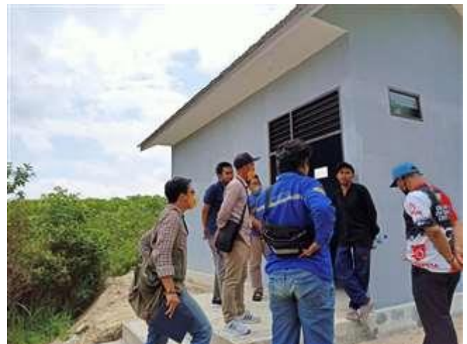
Gambar 4. Tim Survey Bersama Perwakilan Pengelola Program Berkah Air Dondang dan CSR PT. XYZ