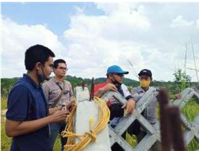
Gambar 3. Tim Survey Bersama Perwakilan CSR PT. XYZ

Disamping dapat memenuhi kebutuhan air warga desa, hasil pengeboran air bersih masih belum memenuhi Standar Baku Air Bersih. Kandungan zat besi (Fe) pada air sangat jelas terlihat pada dinding kolam penampungan air. Sistem pengelola Sarana Air Bersih di desa ini masih mengalami kesulitan dalam mengorganisir pengguna ( costumer ), sehingga berdampak terhadap perawatan peralatan. Hal ini diperjelas dengan sekitar 183 SR/KK mengabaikan pengelola dari 583 SR/KK, selain itu pengelola mempersiapkan debit tambahan untuk 165 SR/KK desa Tamapole. Pengelola juga harus menyisihkan Rp.8.000.000/bulan untuk biaya listrik (PLN).