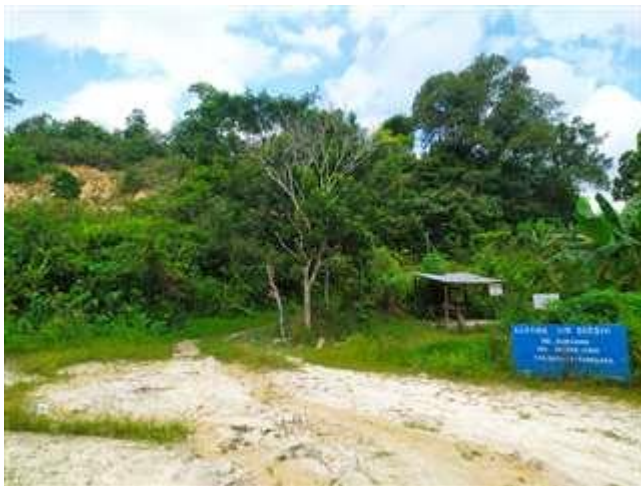
Gambar 1. Lokasi Berkah Air Dondang

Berdasarkan survei pendahuluan yang dilakukan pada tanggal 13 November 2020 di lokasi Berkah Air Dondang, bagian dari program CSR PT. XYZ, Kelurahan Dondang, Kecamatan Muara Jawa, Handil, bahwa air sumur gali yang dihasilkan menimbulkan endapan berwarna cokelat kemerahan pada dinding-dinding kolam penampungan air serta menimbulkan rasa logam besi pada airnya. Kondisi air yang keluar dari pompa secara fisik terlihat jernih, namun ketika didiamkan dalam waktu yang lama akan menimbulkan warna kuning pada air, dinding-dinding kolam penampungan, serta berbau amis yang menandakan kadar besi (Fe) sangat tinggi.