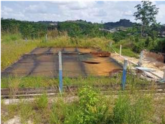
Gambar 5. Kolam 1 Penampungan Air Sarana Air Bersih Berkah Air Dondang

Proses pengangkatan air menggunakan mesin Miura MC-60 berkapasitas 600 lt/menit dan memiliki daya hisap maksimum ( suck max ) sebesar 17 m dari atas permukaan tanah. Proses pengisian kolam penampungan air memanfaatkan daya pendorong pompa yang memiliki head maksimum 22,5 m yang membutuhkan daya listrik 2.000 W dari PLN. Dimensi kolam penampung 12 x 16 x 3 m yang diharapkan mampu dinikmati seluruh warga desa Dondang, dimana jarak tempuh air dari sumber air terhadap kolam penampung mencapai 100 m.