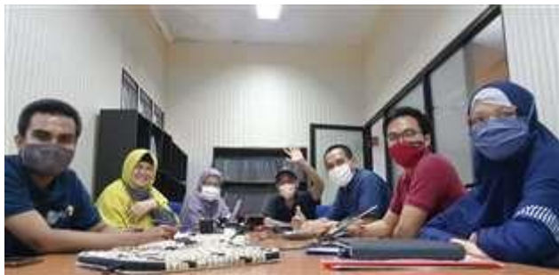
Gambar 7. Rapat Pembahasan dan Analisis Studi Kelayakan Oleh TIM FTI UNIBA

Dalam perencanaan ini diperhitungkan 1,3 kali total kebutuhan perhari. Jadi perencanaan kebutuhan perhari adalah 14.800 \times 1,3 = 19.250 Wh.