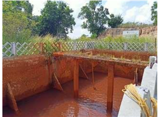
Gambar 6. Kolam 2 Penampungan Air Sarana Air Bersih Berkah Air Dondang

pada kolam dibutuhkan untuk menjaga air pada kolam tetap penuh, sehingga CSR PT. XYZ berinisiatif menambah 1 titik pengeboran air bersih lagi yang ditampung pada kolam yang sama. Jarak antara dua kolam terbentang kurang lebih 10 meter dengan sudut elevasi kurang lebih 2 meter.