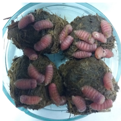
Рис. 9. Личинки гастерофилусов в фекалиях лошадей после обработки ветеринарным препаратом «Празимакс» на третий день. Лаборатория кафедры паразитологии и инвазионных болезней животных ВГАВМ, 2019 г.

Сравнительную оценку экстенсивности противопаразитарных препаратов проводили в хозяйствах Витебской и Гомельской областях. Было подвергнуто обработке 245 лошадей. Терапевтическую эффективность препаратов авермектинового ряда (универм, ривертин 1 %, авермектиновая паста 1 %, ивермектин 1 %, дектомакс 1 %) определяли при кишечных нематодозах лошадей, инвазированных моно- и полиинвазиями, такими как кишечные стронгилятозы + параскариоз, кишечные стронгилятозы + параскариоз + оксиуроз, кишечные стронгилятозы + оксиуроз. Для этого были сформированы опытные группы, по 20 гол. в каждой. По результатам проведенных опытов установлено, что препараты