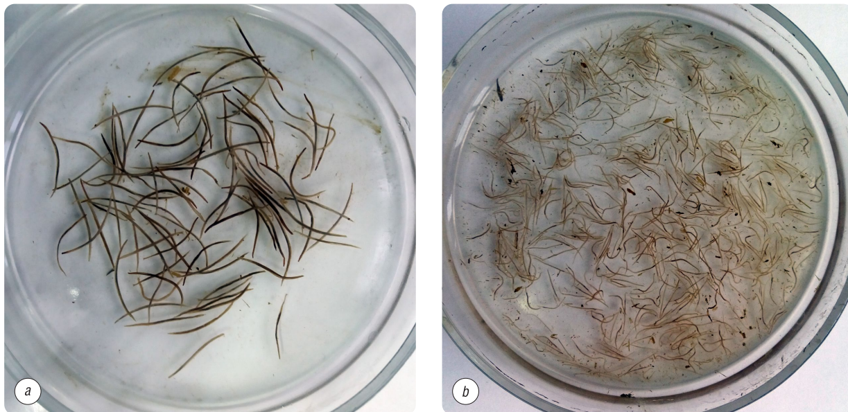
Рис. 1. Доминирующие сообщества кишечных стронгилят: a – половозрелые особи триодонтофорусов (100 экз.); b – половозрелые особи циатостоматид (трихонематид) (500 экз.). Лаборатория кафедры паразитологии и инвазионных болезней животных ВГАВМ, 2019 г.

шего количества видов трихонематид – 21, и 6 видов стронгилид [15, 17, 19]. Из всего сообщества кишечных стронгилят доминирующими видами являются: из сем. Trichonematidae ( Cyathostomidae ) – Cyathostomum tetracanthum , Cylicocyclus nassatus , Cylicostephanus longibursatus , Cylicostephanus goldi , Cyathostomum pateratum , Cylicocyclus insigne , Cylicostephanus minutus , Coronocyclus labiatus , Cylicostephanus calicatus , Cylicocyclus ultrajectinus (рис. 1, a); из сем. Strongylidae – Triodontophorus serratus , Triodontophorus brevicauda (рис. 1, b). Отмечается выделение единичных экземпляров делафондий ( Delafondia vulgaris ) (рис. 2, a) и альфортий ( Alfortia edentatus ) (рис. 2, b).