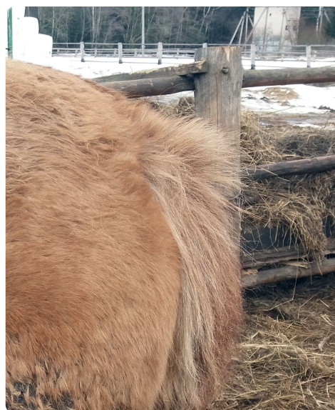
Рис. 4. Патогномотичный симптом при оксиурозе – «зачес» у корня хвоста. Филиал «Полудетки», ОАО «Молоко», Витебск, 2019 г.

Отмечена высокая экстенсивность оксиурозной инвазии с поражением до 60 % (иногда и более) поголовья лошадей при антисанитарных условиях содержания.