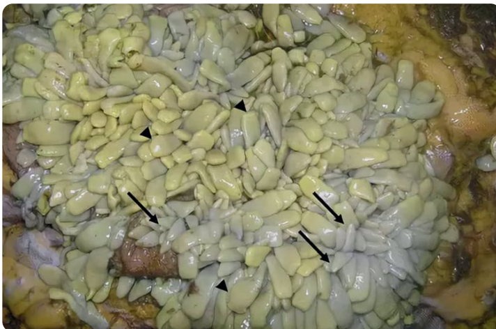
Рис. 6. Гнездовая локализация цестод Anoplocephala perfoliata на слизистой оболочке толстого отдела кишечника

Fig. 5. Juvenile and mature females of Oxyuris equi . Laboratory of the Department of Parasitology and Invasive Animal Diseases of the ASAVM, 2019