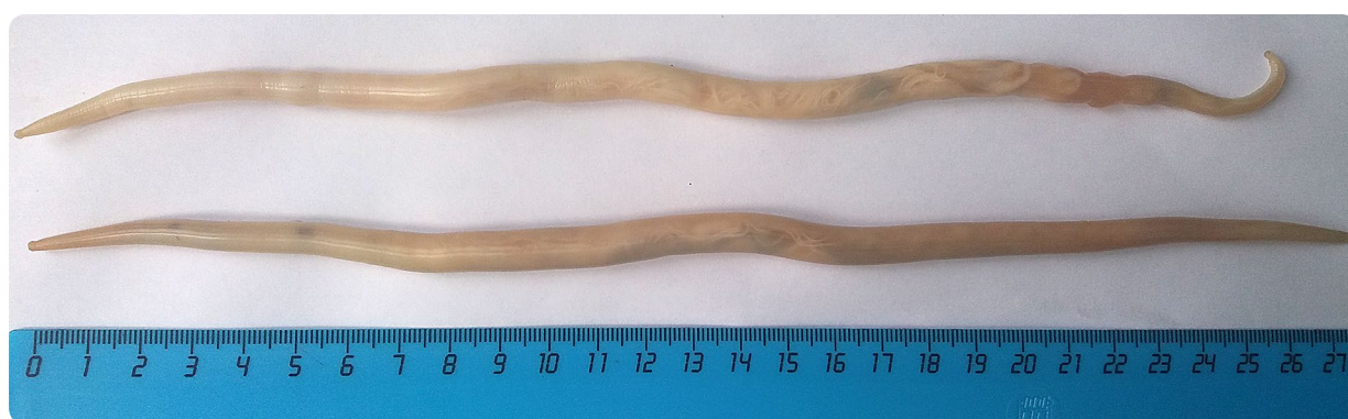
Рис. 3. Нематоды Parascaris equorum . Лаборатория кафедры паразитологии и инвазионных болезней животных ВГАВМ, 2019 г.

У жеребят-сосунов 4–6 мес в тонком отделе кишечника локализуются половозрелые стадии самых крупных нематод пищеварительного тракта лошадей – Parascaris equorum величиной до 30 см и более (рис. 3). Личинки параскаридов при миграции по малому кругу кровообращения