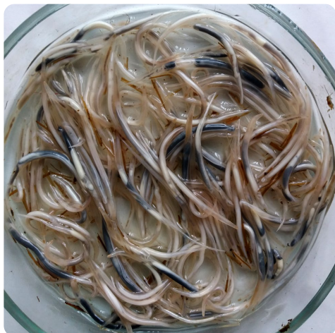
Рис. 5. Ювенильные и половозрелые самки Oxyuris equi . Лаборатория кафедры паразитологии и инвазионных болезней животных ВГАВМ, 2019 г.

Fig. 5. Juvenile and mature females of Oxyuris equi . Laboratory of the Department of Parasitology and Invasive Animal Diseases of the ASAVM, 2019