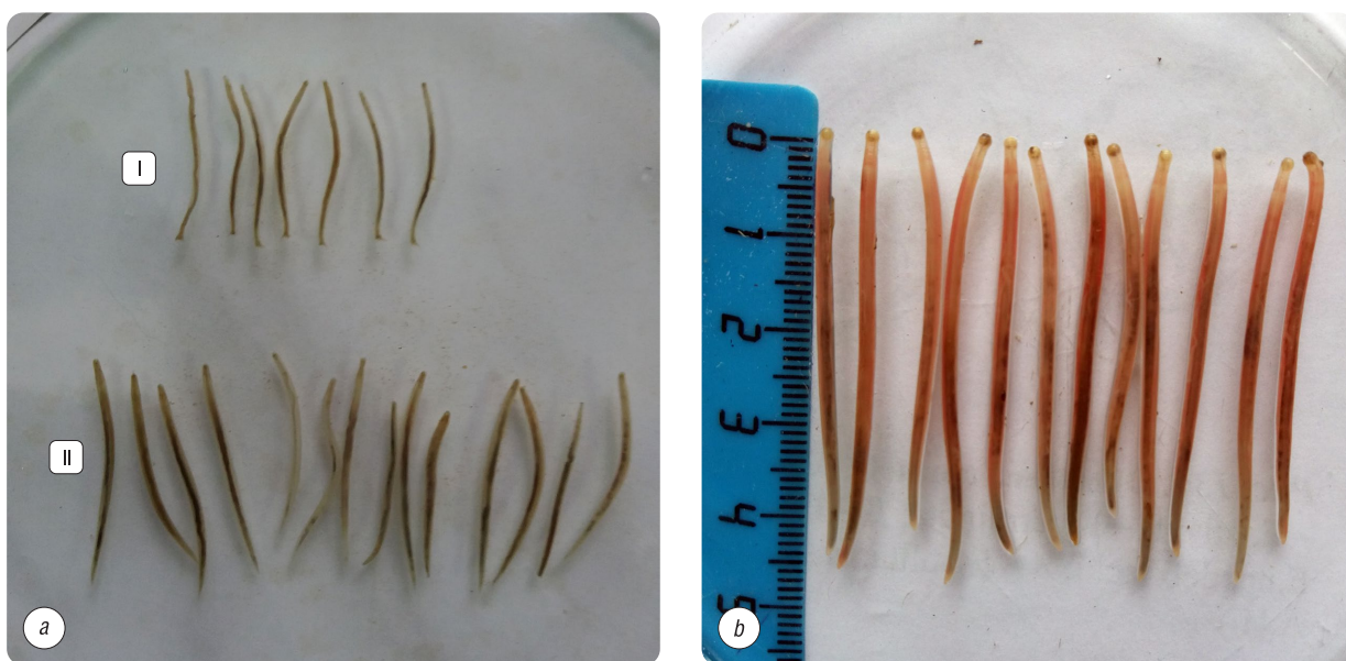
Рис. 2. Половозрелые стадии: a – Delafondia vulgaris (I – самцы, II – самки); b – Alfortia edentatus . Лаборатория кафедры паразитологии и инвазионных болезней животных ВГАВМ, 2019 г.