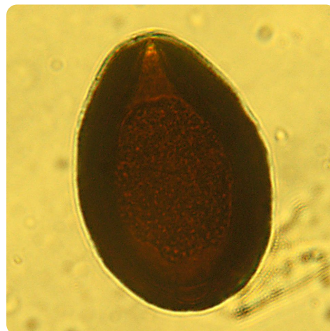
Рис. 8. Ооциста эймерий ( Eimeria leuckarti ). Лаборатория кафедры паразитологии и инвазионных болезней животных ВГАВМ, 2019 г.

Fig. 7. Identified egg of the nematode Trichocephalus suis during study of horses' feces. Laboratory of the Department of Parasitology and Invasive Animal Diseases of the ASAVM, 2019