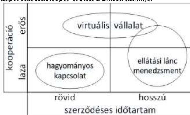
2. ábra. Beszállító – felhasználó kapcsolatai

A beszállító – felhasználó kapcsolat lehetséges eseteit a 2.ábra mutatja.