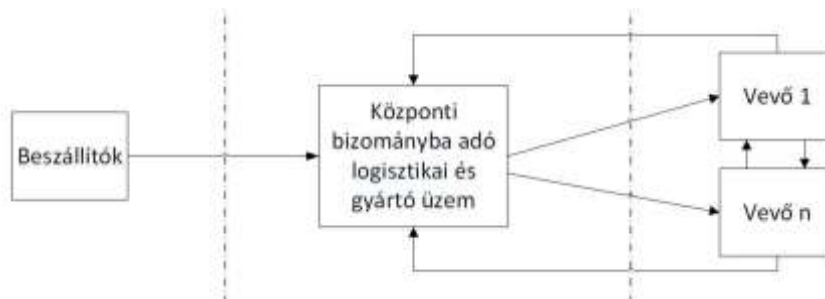
1. ábra: Bizományosi értékesítésű ellátási lánc modell

szigorú előírásoknak kell megfelelni attól kezdve, hogy beszerzik az alapanyagokat, egészen odáig, amíg késztermék válik belőle. Minden gyárnak meg van a saját beszállítója, aki a megfelelő időben, mennyiségben és minőségben leszállítja az alapanyagokat [2]. A szállítások rendszeresek, de ettől függetlenül a gyárban is kell az alapanyagokat tárolni, amihez a megfelelő körülményeket ki kell alakítani, úgy, mint például az előírt hőmérséklet, tárolóedény, megfelelő ruházat, stb. Ezután kezdődhet a termelés. A bizományosi értékesítésű hálózat egyik fő különbségét a többi ellátási lánc típushoz képest az 1. ábra mutatja.