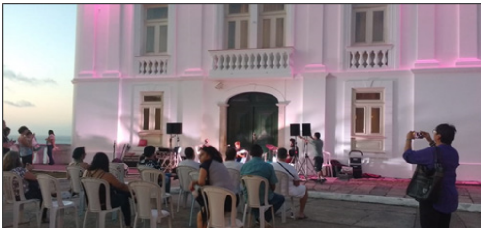
Figura 2: Projeto Pôr do Sol no Palácio no Palácio dos Leões

e fazendo parte de forma mais estreita. Já o Projeto Pôr do Sol no Palácio é realizado na Avenida Dom Pedro II, em frente ao Palácio dos Leões, sede do Governo do Estado, como mostra a figura 02.