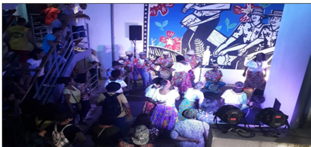
Figura 1: Projeto Quarta do Tambor na Casa do Tambor de Crioula

Na região da Praia Grande existem diversas manifestações e intervenções acontecendo a todo momento, dentre estas, alguns projetos coordenados pela Secretaria de Estado da Cultura do Maranhão (SECMA), como é o caso do Projeto Quarta do Tambor de Crioula, realizado na Rua da Estrela, em frente à Casa do Tambor de Crioula do Maranhão, que pode ser observado na Figura 01. O projeto concentra suas atividades em um conjunto de apresentação de Tambor Crioula, manifestação típica maranhense, podendo ser coletivos de manifestação inspirada na cultura africana com elementos particulares da identidade e modo de fazer maranhense (MARANHÃO, 2019).