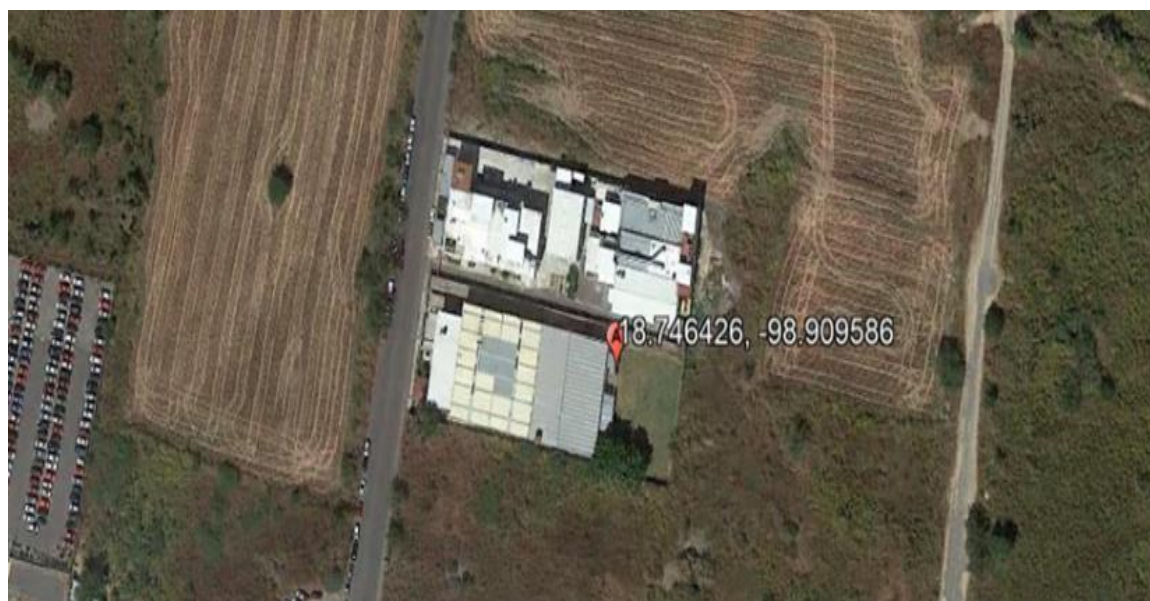
Figura 1. Localización geográfica del Campo Experimental de la Escuela de Estudios Superiores de Xalostoc (EESuX).