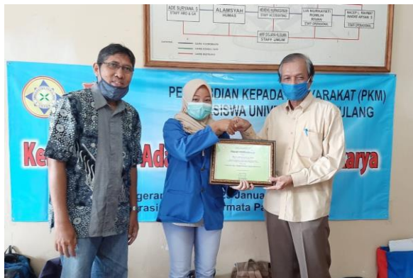
Gambar 2. Pemberian Cenderamata PKM