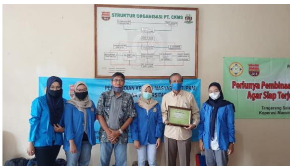
Gambar 3. Dokumentasi PKM Mahasiswa & Dosen Pendamping