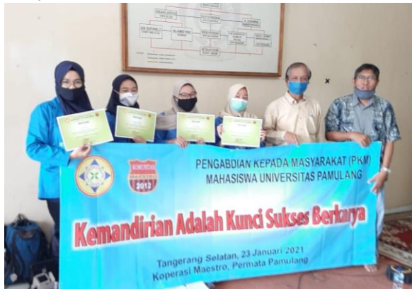
Gambar 1. Dokumentasi peserta PKM Mahasiswa

Berikut dokumentasi kegiatan pengabdian masyarakat: