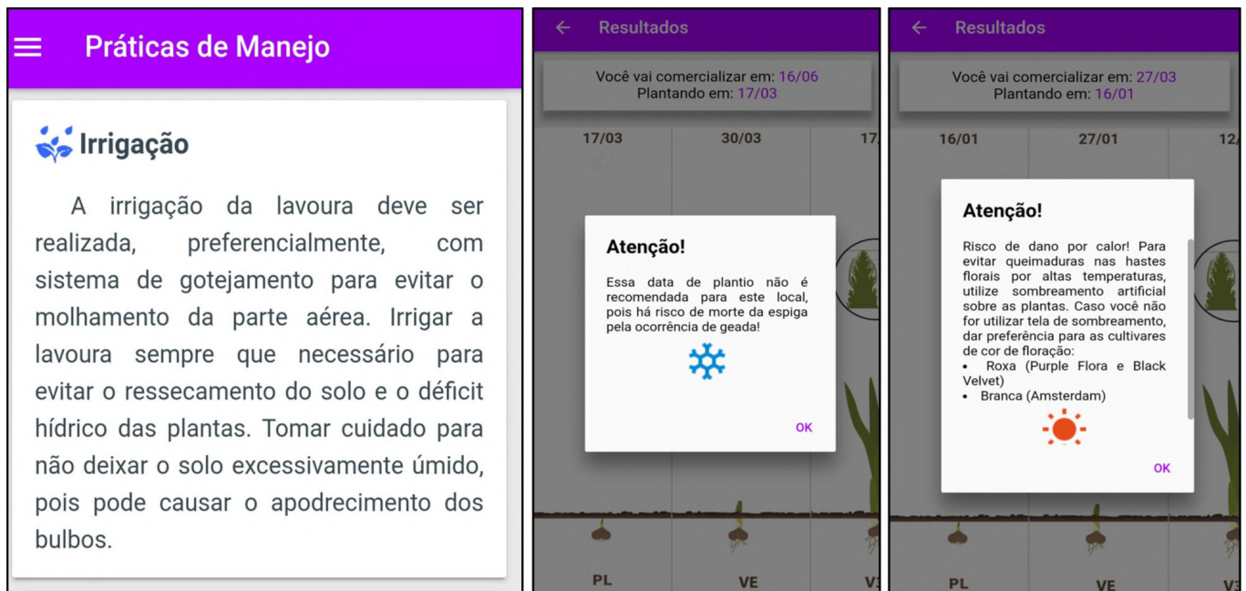
Figura 3. Descrição da prática de manejo irrigação e simulações que resultaram em alertas de danos ocasionados pelo frio em Curitiba, SC, com plantio em 17/03, e por calor em São Miguel do Oeste, SC, com plantio em 16/01. Autor: Leosane C. Bosco Figure 3. Description of management practice Irrigation and simulations that resulted in warnings of damage caused by the cold in Curitiba, SC with planting on 17 March and by heat in São Miguel do Oeste, SC with planting on 16 January. Author: Leosane C. Bosco

nhecidos já utilizaram essa ferramenta para planejamento da produção. Além disso, o app está em constante atualização e sendo utilizado em atividades de ensino, pesquisa e extensão em SC. O projeto de extensão Flores para Todos utiliza o aplicativo para dar orientações e suporte aos produtores de gladiolo que estão sendo atendidos pela Equipe PhenoGlad SC.