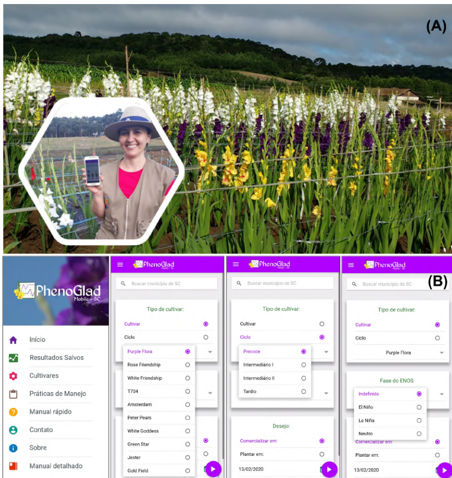
Figura 1. Área de gladiólios planejada com PhenoGlad Mobile SC (A) e interface do aplicativo (B). Autor: Leosane C. Bosco Figure 1. Gladiolus area planned with PhenoGlad Mobile SC (A) and interface of the App (B). Author: Leosane C. Bosco

motivador para o desenvolvimento do PhenoGlad Mobile SC. Esses aplicativos vêm sendo usados desde 2018 por extensionistas, produtores e escolas do campo para o planejamento do cultivo de gladiólio visando à diversificação de culturas e de renda de agricultores (UHLMANN et al., 2019). É a principal ferramenta de manejo do gladiólio no projeto Flores para Todos, uma iniciativa da extensão rural que visa levar a floricultura como uma alternativa de renda para agricultores familiares e manter o jovem no campo. Desde seu início em 2018 até final de 2019, alcançou 55 municípios nos estados da Região Sul do Brasil e beneficiou 67 famílias e 10 escolas do campo, com produção de 48 mil hastes florais de gladiólio.