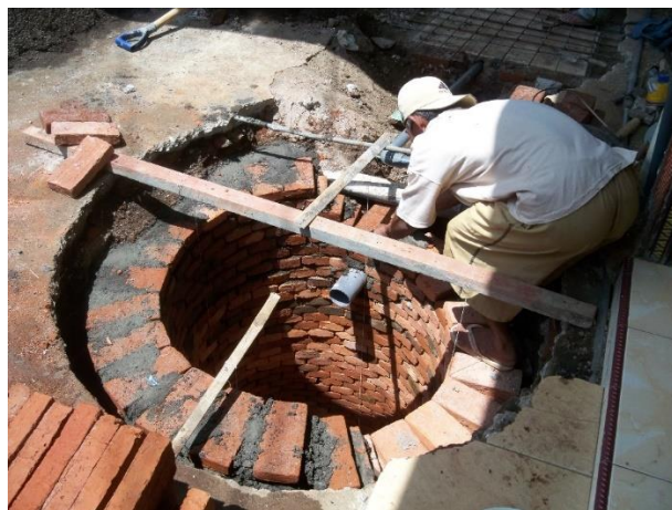
Gambar 5. Pekerjaan Pembuatan Sumur Resapan

Pekerjaan pembuatan peresapan mulai dilakukan pada tanggal 21 Juni 2020. Pekerjaan ini juga dilakukan oleh tukang batu yang dibantu oleh kuli batu dan jamaah musholla. Pekerjaan ini meliputi pemasangan batu bata tanpa plesteran dan pembuatan tutup peresapan dari beton bertulang. (Gambar 5).