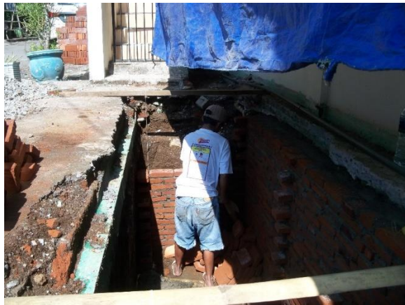
Gambar 4. Pekerjaan Pembuatan Septictank

Pekerjaan pembuatan septictank mulai dikerjakan pada tanggal 14 Juni 2020. Pekerjaan ini dilakukan oleh tukang batu yang dibantu oleh kuli batu. Jamaah musholla membantu mempersiapkan material yang dibutuhkan untuk pemasangan batu bata dan beton. Septictank dibuat dari pasangan batu bata dengan plesteran kedap air yang bagian atasnya ditutup dengan plat beton bertulang (Gambar 4).