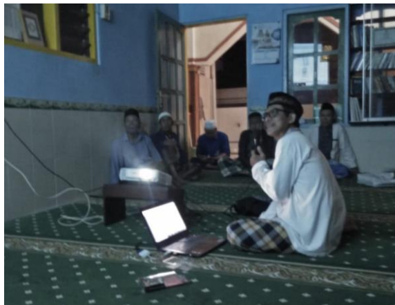
Gambar 2. Pertemuan Tim dengan Jamaah Musholla Al-Amin