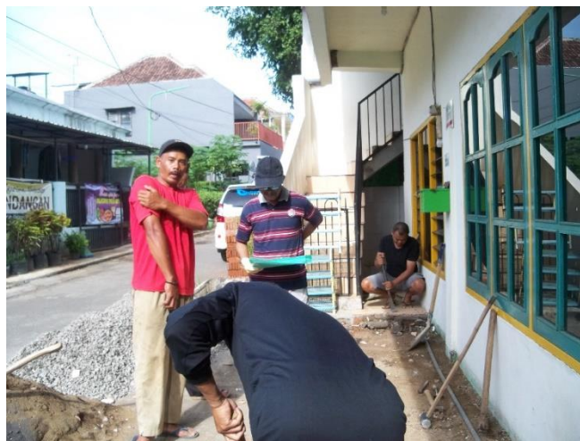
Gambar 3. Pekerjaan Galian Tanah

Pekerjaan galian tanah dikerjakan pada tanggal 6 dan 7 Juni 2020. Pekerjaan ini meliputi galian tanah untuk septictank dengan volume 4,87m 3 dan galian tanah untuk peresapan dengan volume 1,87m 3 . Pekerjaan galian tanah dilakukan oleh tukang gali dan jamaah membantu membuang hasil galian tanah ke pekarangan kosong dengan jarak kurang lebih 50m dari musholla.