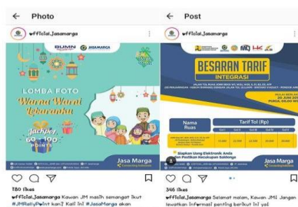
Gambar 4. Postingan Instagram PT Jasa Marga

Saat ini pengikut akun media sosial sudah berjumlah sekitar 27 (dua puluh tujuh) ribu dan berdasar pada pernyataan key informan , pengikut tersebut bukanlah pengikut palsu atau bukan menggunakan jasa membeli pengikut. Akan tetapi, angka tersebut merupakan pengikut organik yang artinya bukan kumpulan dari banyak akun palsu.