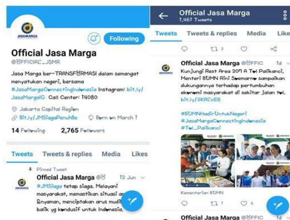
Gambar 6. Tampilan utama media sosial Twitter korporasi dan beberapa postingan terkait kegiatan PT Jasa Marga (Persero) Tbk

Sedangkan untuk Twitter korporasi lebih mengutamakan informasi yang berkaitan dengan kegiatan perusahaan dan juga perkembangannya. Informasi mengenai kerjasama dengan pemerintah, tentang perkembangan pembangunan jalan tol baru dan lain-lain.