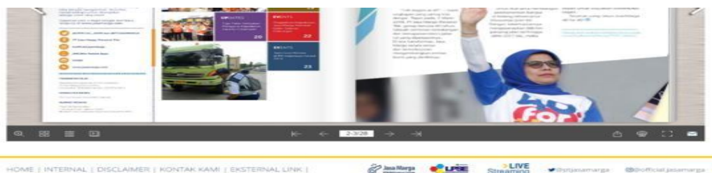
Gambar 2. Penggunaan website resmi sebagai media pengenalan media sosial

Kegiatan Humas tidak dapat lepas dari sebuah media yang dalam hal ini merupakan jembatan untuk mengantarkan tujuan daripada sebuah kegiatan itu sendiri agar dapat diketahui dan diterima oleh masyarakat atau target sasaran kegiatan. Pada kegiatan pengelolaan media sosial ini, PT Jasa Marga (Persero) Tbk mencantumkan media sosial pada setiap magazine perusahaan, dan juga memanfaatkan media sosial itu sendiri dengan memanfaatkan fitur iklan pada media sosial Facebook , Twitter , Instagram dan juga memaksimalkan informasi mengenai media sosial ini di website resmi PT Jasa Marga (Persero) Tbk.