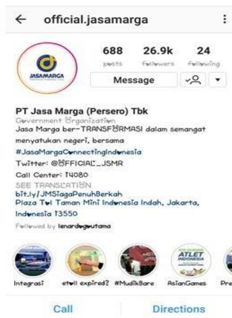
Gambar 3. Halaman utama Instagram PT Jasa Marga (Persero) Tbk

Media sosial Instagram dihidupkan kembali untuk dapat dioptimalkan dalam rangka penyebaran informasi kepada pengguna jalan tol lebih baik lagi. Jika pada Twitter , PT Jasa Marga (Persero) Tbk memiliki 2 (dua) macam akun dengan fungsi yang berbeda. Fungsi Instagram ini lebih untuk melengkapi keberadaan Twitter korporasi. Kekhasan yang paling menonjol daripada Instagram adalah tampilan aplikasinya yang memanjakan mata. Aplikasi yang memang menjadikan gambar sebagai komoditasnya ini dimanfaatkan oleh PT Jasa Marga (Persero) Tbk untuk menampilkan lebih detail lagi informasi dalam bentuk video berdurasi panjang ataupun slide pictures . Dimana pada Twitter yang tidak terlalu fokus pada gambar ataupun video.