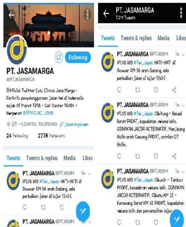
Gambar 5 Tampilan utama dan beberapa postingan media sosial Twitter lalu lintas PT Jasa Marga (Persero) Tbk

Kemudian sesuai hasil evaluasi besar perusahaan tentang apa pesan atau trik yang tepat untuk disajikan kepada masyarakat khususnya pengguna jalan tol dan media apa yang efektif untuk melaksanakan tujuan itu, maka semua media sosial yang dimiliki PT Jasa Marga (Persero) Tbk dihidupkan kembali pada tahun 2017. Selain menghidupkan kembali, pihak perusahaan pun menambahkan Twitter korporasi yang akan lebih fokus kontennya. Selain menghidupkan kembali, pihak perusahaan pun menambahkan Twitter korporasi yang akan lebih fokus kontennya tentang perusahaan secara umum.