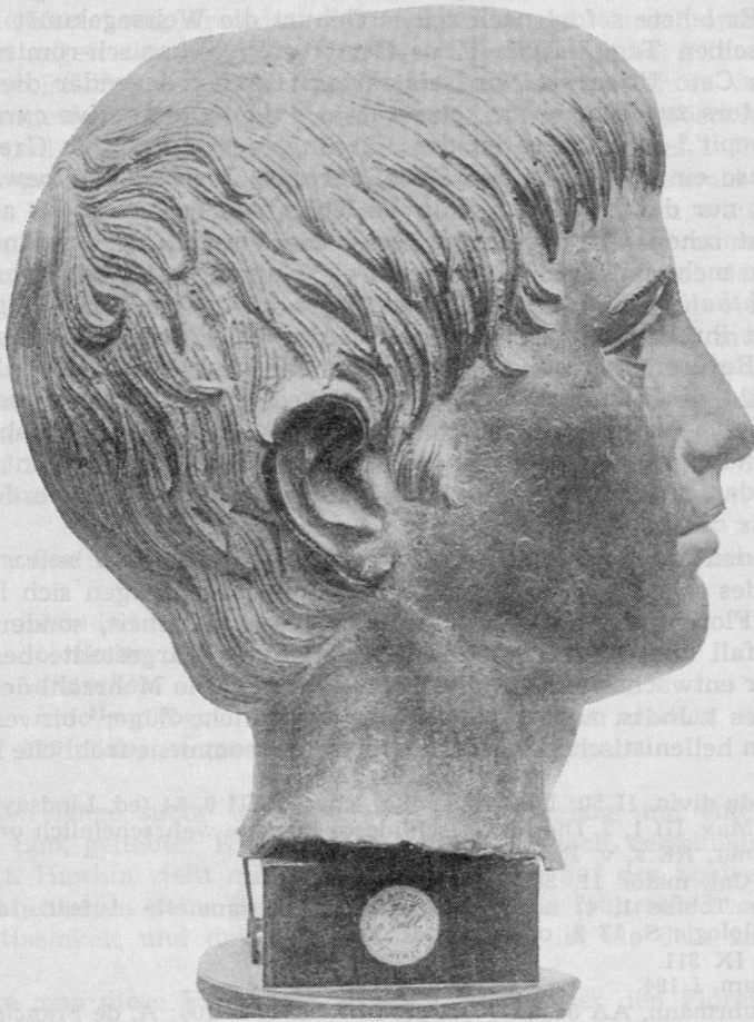
Abb. 2. Florenz, Archäologisches Museum. Bronzener Knabekopf Sl. 2. Arheološki muzej v Firencah. Glava dečka, bron

kann ihn ab dem 2. oder 1. Jhdt v. Chr. in literarischen Zitaten feststellen, findet ihn in verstärkter Dichte in der Spätantike und im frühen Mittelalter bis etwa in das 7. Jhdt. hinein und verfolgt verblasste Ausläufer derselben Vorstellung in späterer Literatur, zuletzt bei dem gelehrten spanischen Dichter Gongora y Argote (1561—1627). Es geht aus seinen Darlegungen hervor,