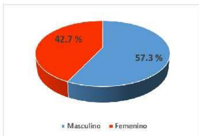
Figura 01: Distribución de la población de pacientes hipertensos, según sexo.