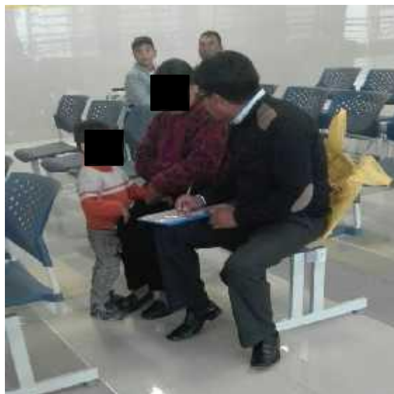
Fotografía 1: Encuestando a los pacientes hipertensos