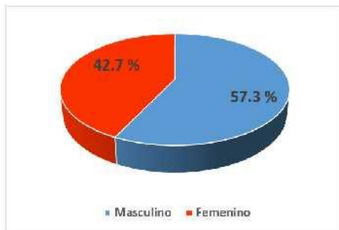
Figura 01: Distribución de la población de pacientes hipertensos, según sexo.